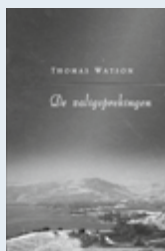
Uit: "De zaligsprekingen", Thomas Watson (uitg. Den Hertog).

Basilius de Grote noemt dit het onuitwisbare merkteken van een ziel die genade bezit: Zalig zijn de zachtmoedigen. Om dit te verduidelijken, zal ik laten zien wat deze zachtmoedigheid is. Zachtmoedigheid is een genadegave waardoor Gods Geest ons in staat stelt onze hartstocht te matigen. Het is een genadegave. De filosoof noemt haar een deugd, de apostel noemt haar een genadegave (Gal. 5:22). (wordt vervolgd)