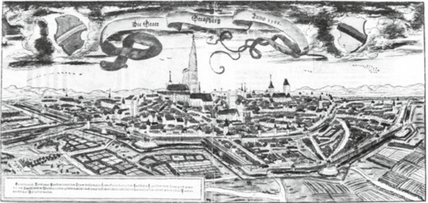
Gezicht op Straatsburg in de 16e eeuw.

(bron: Apperloo/Selderhuis, 'Calvijn en de Nederlanden')