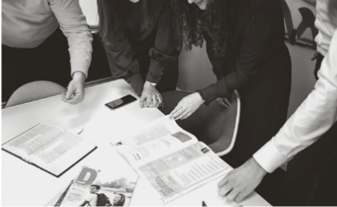
Hoe krijgen we jongeren aan het lezen?

Hoe krijg ik mijn puber aan het lezen? Vroeger luisterde hij ademloos als ik hem voorlas en verslond hij kinderboek na kinderboek uit de bibliotheek van de kerk. Nu leest hij niets meer. Nou ja, behalve op z'n mobiel dan.