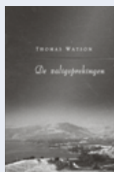
Uit: "De zaligsprekingen", Thomas Watson (uitg. Den Hertog).