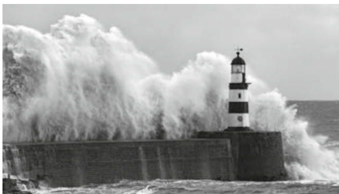
De vloedgolf van de genderideologie bedreigt het bestaan van de christelijke kerk.