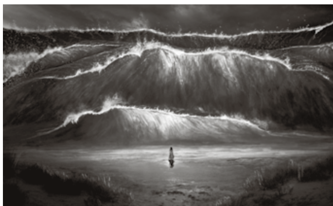
De vloedgolf van de hedendaagse genderideologie deint mee op de toppen van het menselijk gevoel.

mensen en een doorkruisen van Gods bedoeling met het werk van Zijn handen.