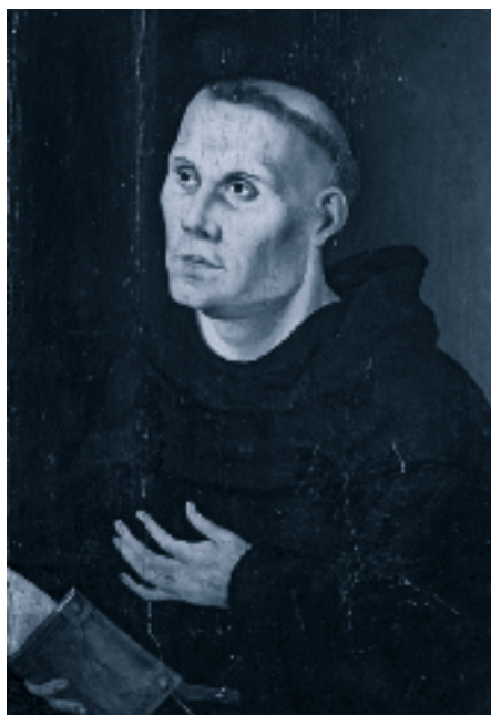
In hope zalig.

Luther schreef zijn Galatenbrief dus voor 'ontroerden en bekommerden'. Het boek heeft daarmee een nadrukkelijk pastorale spits. Luther zocht naar een troost die in de hoogste aanvechting stand zou houden. Eigenlijk is dat de kern van heel Luthers theologie. Toen ik op catechisatie eens over 'bekommernis' sprak, vloog een meisje op, en