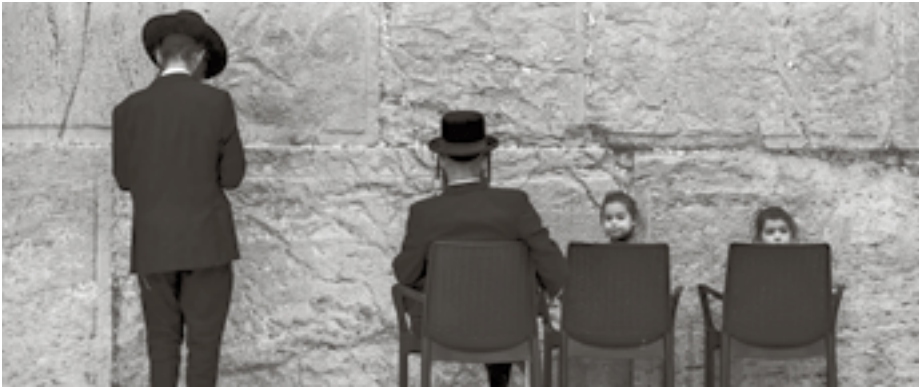
Dat Joden het Nieuwe Testament bestuderen is niet nieuw.

Het studiewerk behelst een commentaar op het gehele Nieuwe Testament in de Duitse Lutherbijbel door ruim tachtig gerenommeerde joodse geleerden uit de gehele wereld. Dit joods commentaar wil de kloof tussen jodendom en de kerk de wereld uit helpen. De achterliggende gedachte is dat het Nieuwe Testament niet alleen een boek is voor christenen, maar ook een door en door joods boek.