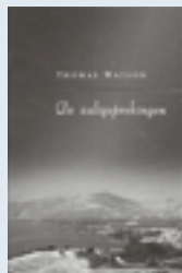
Uit: "De zaligsprekingen", Thomas Watson (uitg. Den Hertog).