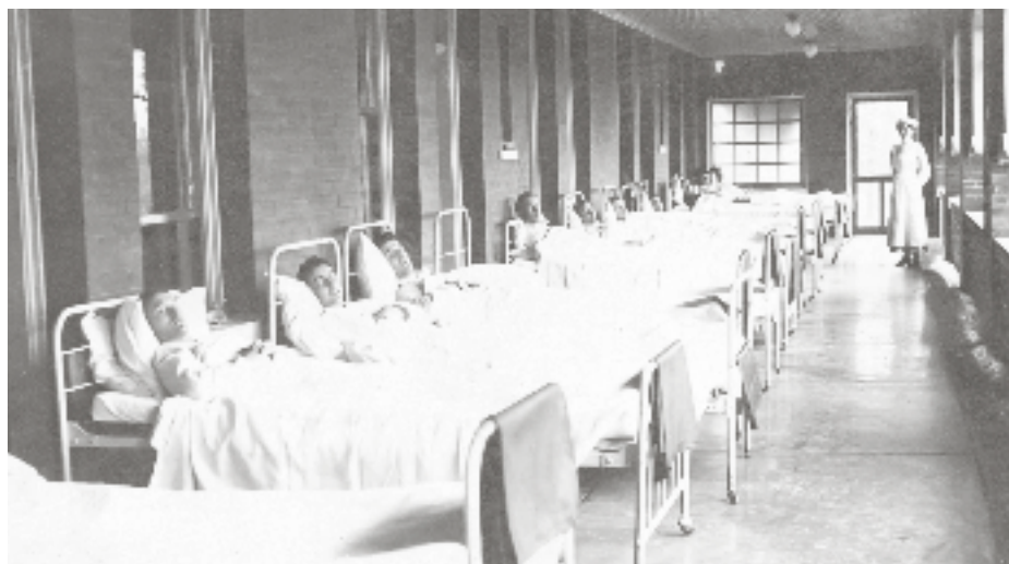
‘Mensen die voelen dat ze ziek zijn, zullen de voorgeschreven middelen, hoe onaangenaam en bitter de smaak ook is, trouw gebruiken.’

Uit: Theodorus Avinck, “Wendt u naar Mij toe; praktikale verhandelingen”, uitg. Den Hertog, Houten, 2020.