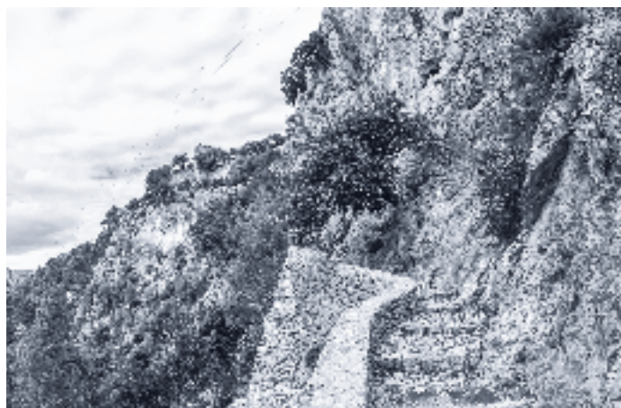
De wereld wordt een land dat alleen maar afmat en vermoeit.

Toch ligt er op de bodem van het hart wel het verlangen om bij Christus te zijn. Die andere