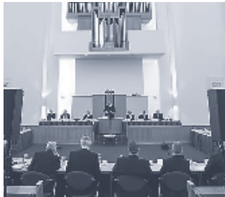
In september komt de Generale Synode van de Gereformeerde Gemeenten weer bijeen.

Dat betekent overigens niet dat het een meerdere vergadering zoals de GS ontbreekt aan een zeker gezag. Desgevraagd wijst ds. Silfhout op de eerste meerdere vergadering die ooit werd gehouden. Daarover wordt geschreven in het Bijbelboek Handelingen. 'Op het apostelconvent in Jeruzalem (Hand. 15) werden besluiten met bindende kracht genomen voor Antiochië en voor de gemeenten in Syrië en Cilicië. Dit apostelconvent was wel geen synode, maar de besluiten werden aan de gemeenten gegeven als verordeningen (dogmata). De reformatoren zagen het samenleven van gemeenten als een Bijbelse opdracht