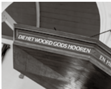
Hoe lezen we de Bijbel en welk gezag heeft het spreken van de Heere over ons?

Inmiddels zijn we er haast aan gewend geraakt dat een andere kerk, de Gereformeerde Kerken vrijgemaakt (GKv), alle ambten hebben opengesteld voor vrouwen. Toch was het opzienbarend dat de Generale Synode in 2017 dit besluit nam. De vrijgemaakte kerken waren lange tijd een bolwerk van rechtzinnigheid. Rond