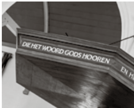
Het spreken van God tot de mens, door Zijn Woord, is een spreken met gezag.

In het spoor van de Verlichting ging de mens een andere plaats innemen ten opzichte van de Bijbel. Hij staat niet meer onder het absolute gezag van Gods Woord, maar gaat zelf bepalen welke waarde de Bijbel heeft. De Bijbel wordt