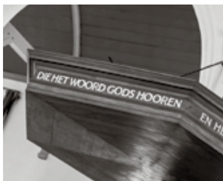
De Bijbel is duidelijk over de positie van man en vrouw in de gemeente.

Ook klonk het argument dat in de geschiedenis de leiding van de Heilige Geest is te zien. Er is een ontwikkeling gaande van schepping naar herschepping, zo luidt de redenering. Dit beïnvloedt op een positieve wijze de positie van de vrouw. Hierbij is de sleuteltekst Galaten 3:27-28. 'In Christus' telt het verschil tussen man en vrouw niet meer. Ze zijn nu dus gelijk. Vrouwen waren de eerste 'verkondigers' van Christus' opstanding. De apostelen waren weliswaar mannen, maar dat had nog te maken met de verhoudingen van toen. Als Christus vrouwen inschakelt, is dat een signaal dat ze in de kerk van het