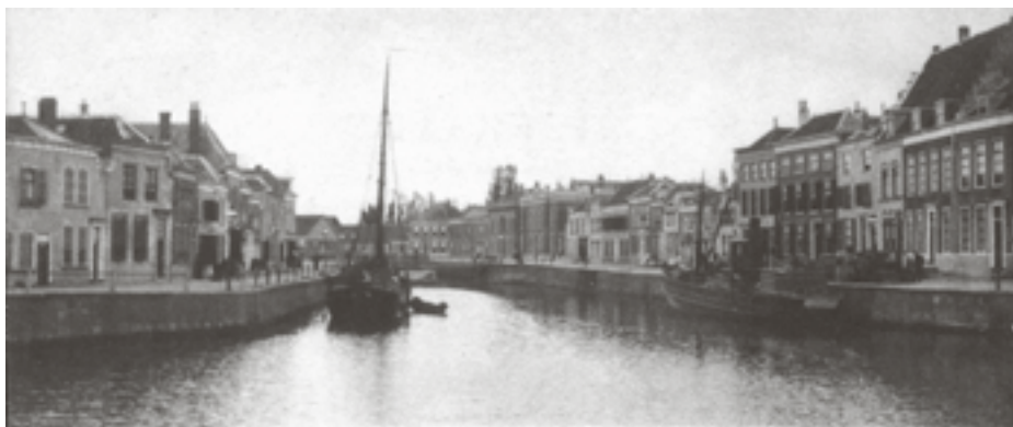
Het water in de haven van Goes was niet geschikt als drinkwater

Op zondagavond 17 januari 1864 was er in het huis van ds. Drost in Goes brand uitgebroken. Een groot deel van zijn bezittingen was in vlammen opgegaan.