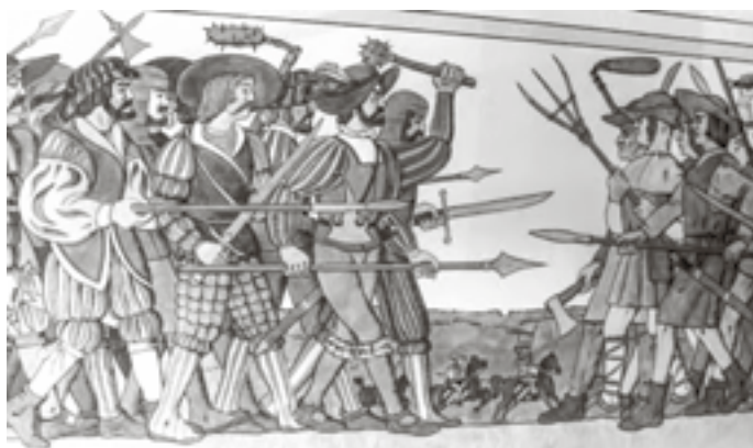
Adel tegen boeren

Boerenonrust is deze weken voorpaginanieuws. De plannen van de regering om boerenbedrijven te onteigenen treffen boerenfamilies in het hart. Zij hebben generaties lang alles gegeven voor hun bedrijf.