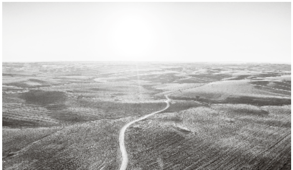
In het sabbatsjaar laten tal van Israëlische boeren hun akker vrijwillig braak liggen.