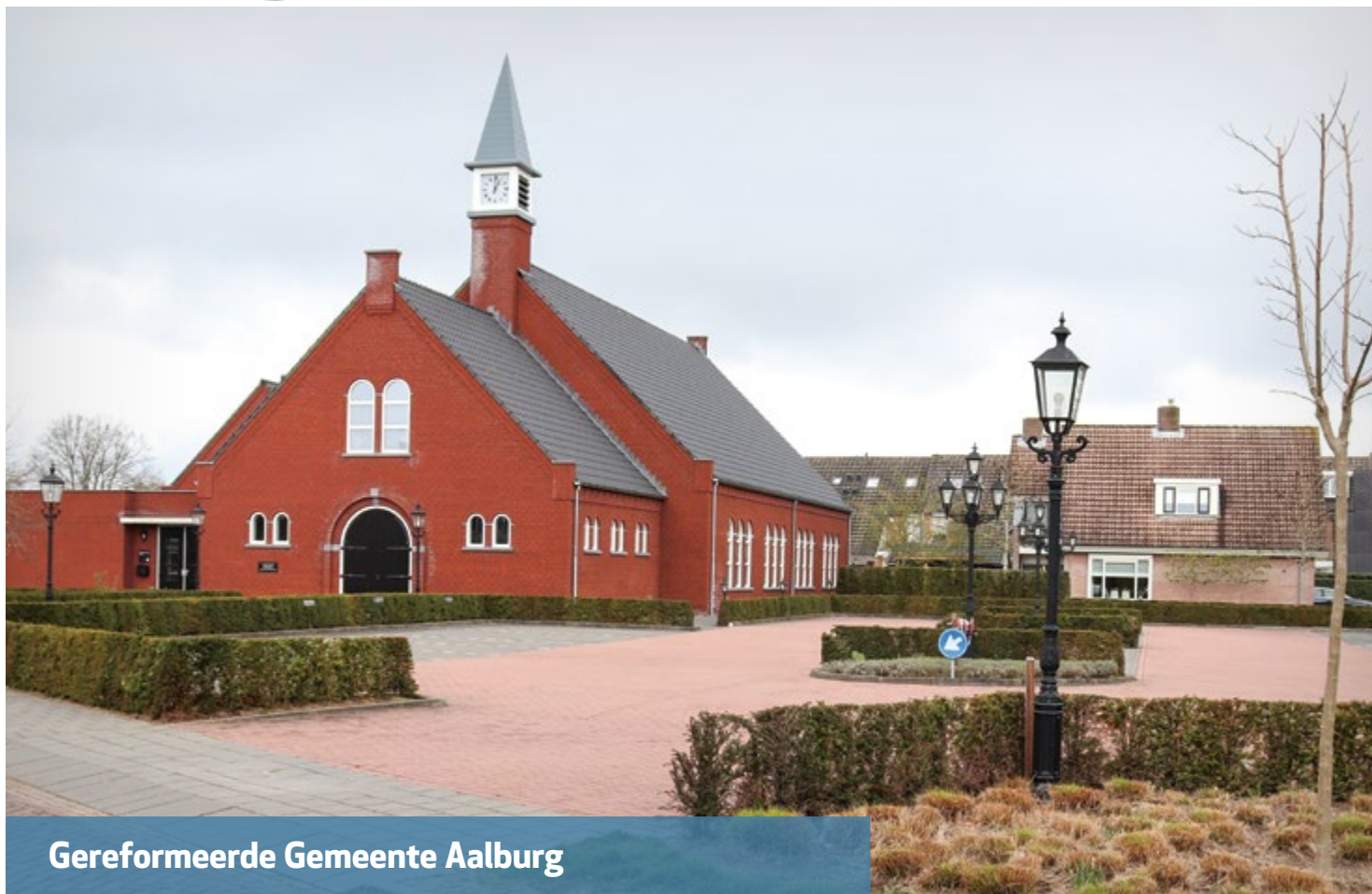
Gereformeerde Gemeente Aalburg