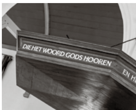
In onze tijd leeft een sterk besef van het eigen gelijk.

Enkele dagen na de synodebesluiten werd in de Christelijke Gereformeerde Kerk van Zwolle een kanselboodschap voorgelezen.