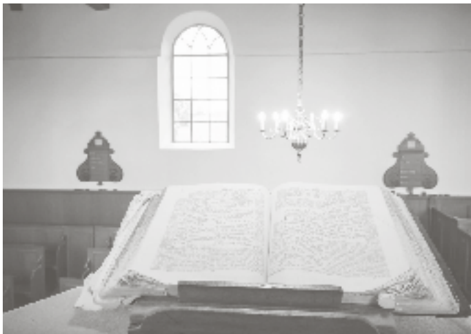
De Bijbel draagt een exclusief karakter.