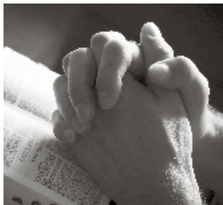
Augustinus: 'God en de ziel begeer ik te kennen'.

In "Soliloquium" is een gebed opgenomen. Daarin bad hij: 'Beveel, bid ik U, en gebied al wat Gij wilt, maar genees en open mijn oren opdat ik daarmee Uw Woorden hore'.