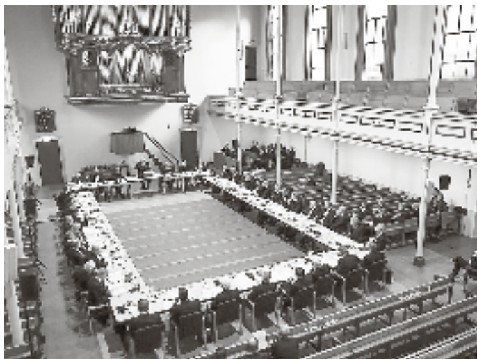
De Generale Synode van de Gereformeerde Gemeenten kwam vele malen bijeen in de Westerkerk te Utrecht.