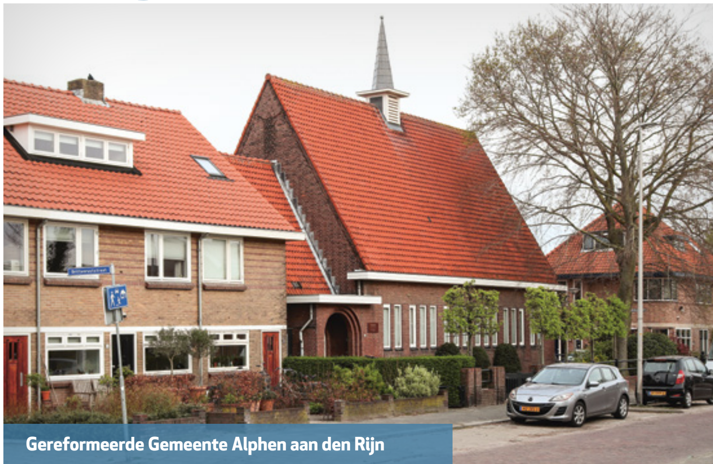
Gereformeerde Gemeente Alphen aan den Rijn