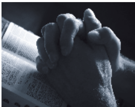
Thomas à Kempis: 'Laat dit uw streven en uw zorg zijn, dat God met u is, in alles wat gij doet.'

die van Deventer stond goed aangeschreven omdat het geestelijke klimaat daar gestempeld werd door de Moderne Devotie. Die vroomheidsbeweging legde sterk de nadruk op een ingekeerd, mystiek leven dat gewijd was aan de dienst van God. Later werd Thomas tot priester gewijd. Intussen had hij al vrij veel geschreven en gekopieerd. Hij leefde nog vóór de uitvinding van de boekdrukkunst en hij was een van de vele kopiïsten. Die waren in zijn tijd onmisbaar. Hij heeft in zijn lange leven alleen de Bijbel al vier keer overgeschreven.