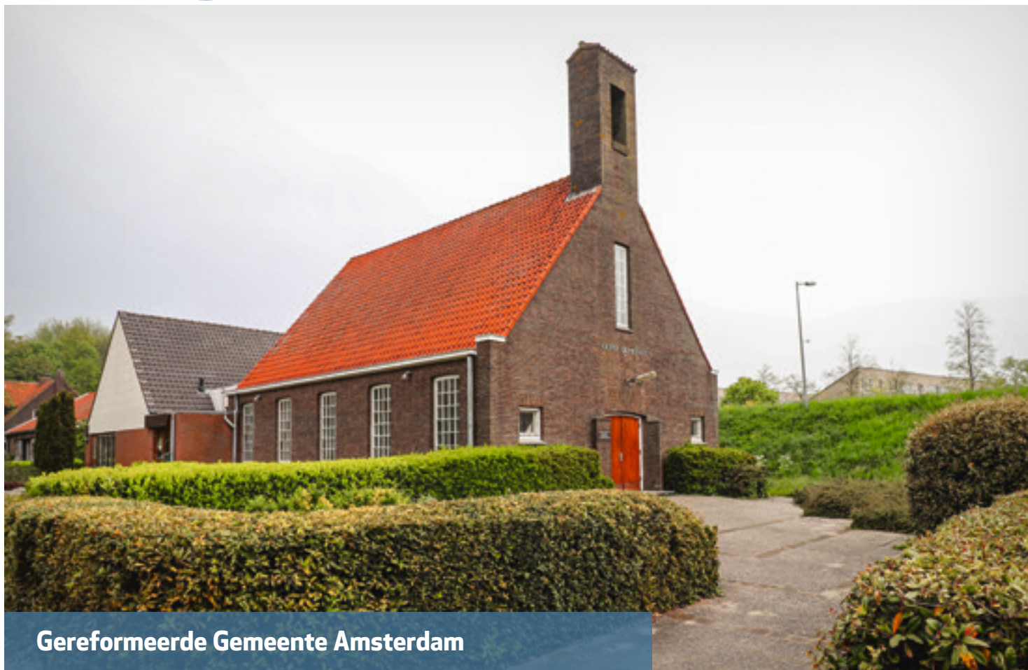
Gereformeerde Gemeente Amsterdam