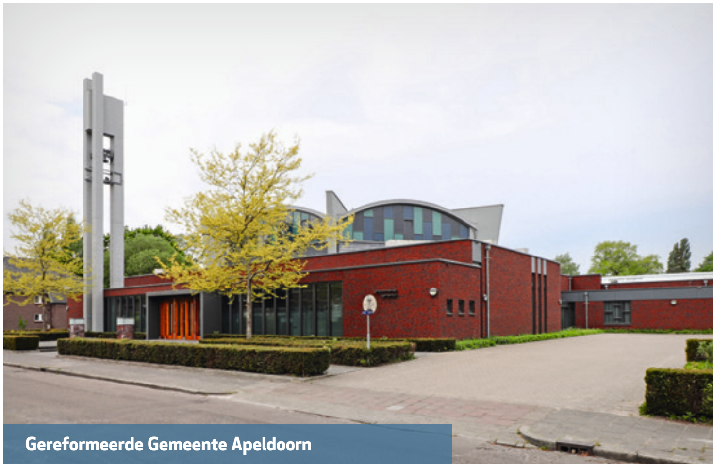
Gereformeerde Gemeente Apeldoorn