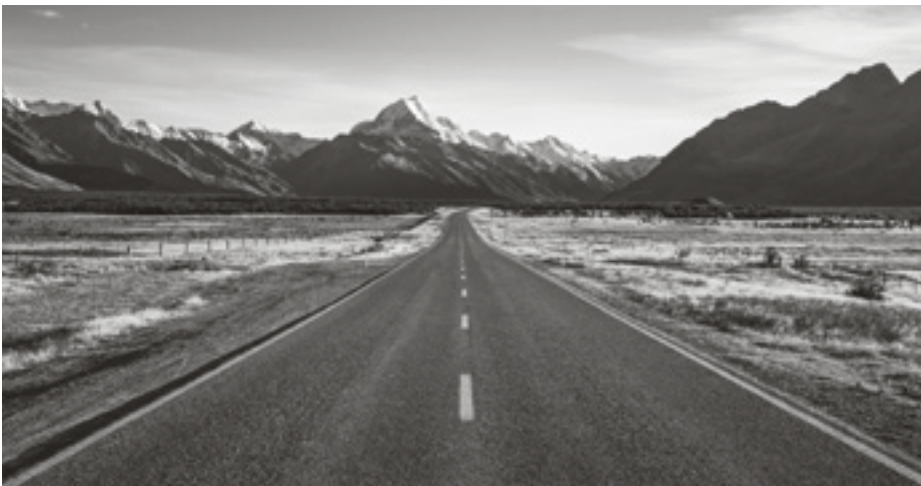
Wat is het een verantwoordelijk werk om aan zielen leiding te geven, om de weg te wijzen.