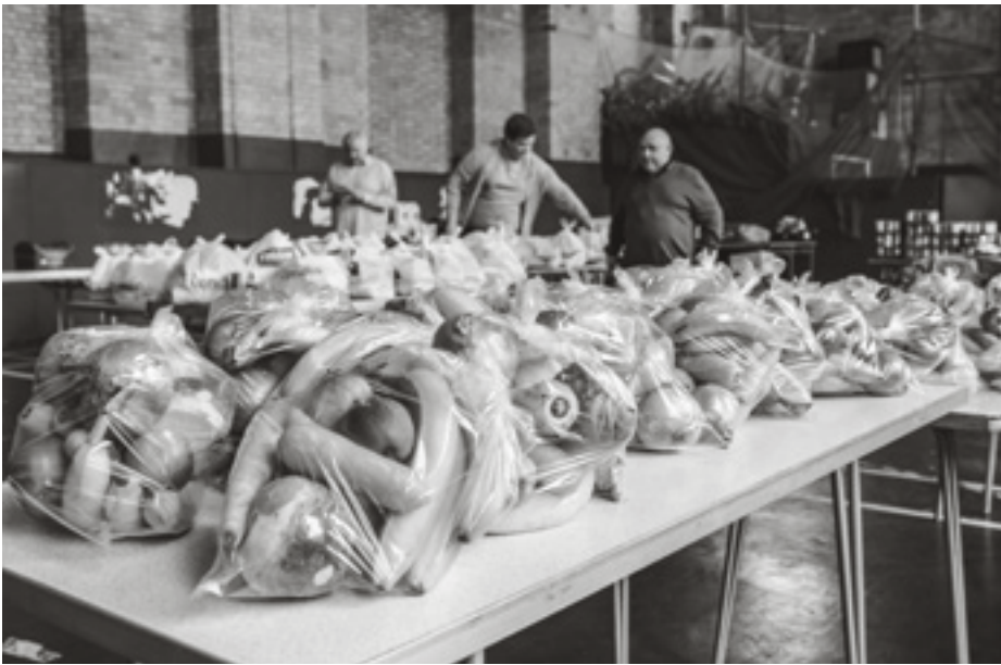
De gang naar de voedselbank kan heel gevoelig liggen.

De uitleg was nogal onthutsend: in vroeger tijden konden de armen zich melden bij de diaconie. Dan moesten ze plaatsnemen op de betreffende bank. Een voor een werden ze naar voren geroepen en kregen ze brood en misschien wat andere eerste levensbehoeften. Op zich mooi dat ze dat kregen, maar moest dat nu zó? Voor het oog van alle burgers van de stad moest je dus met je armoede openbaar komen.