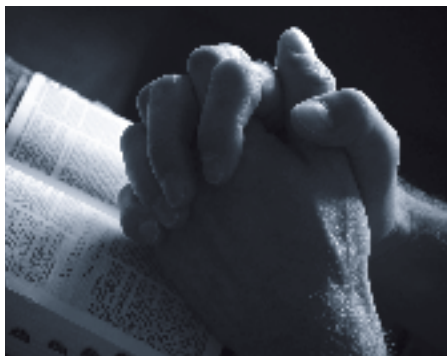
Theodorus van der Groe: 'O mensen, wie gij ook zijt, begeeft u tot een nauw en ernstig onderzoek van uzelf.'

Hierboven gebruikten we het woord 'toetsen' en 'toetssteen'. Diverse oudvaders hebben een boek geschreven met dit