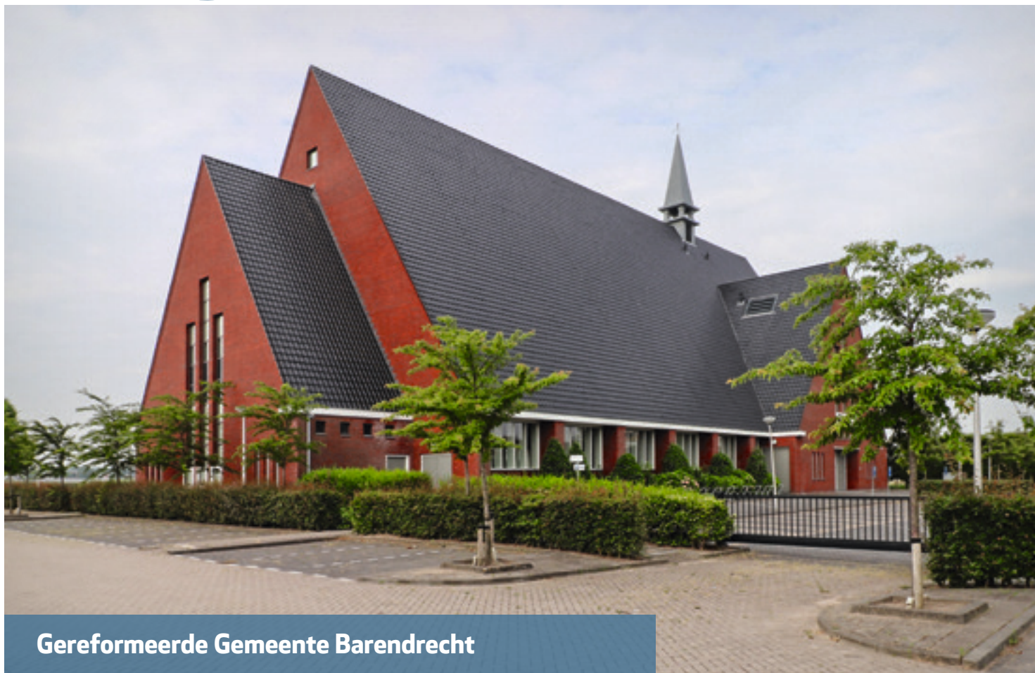
Gereformeerde Gemeente Barendrecht