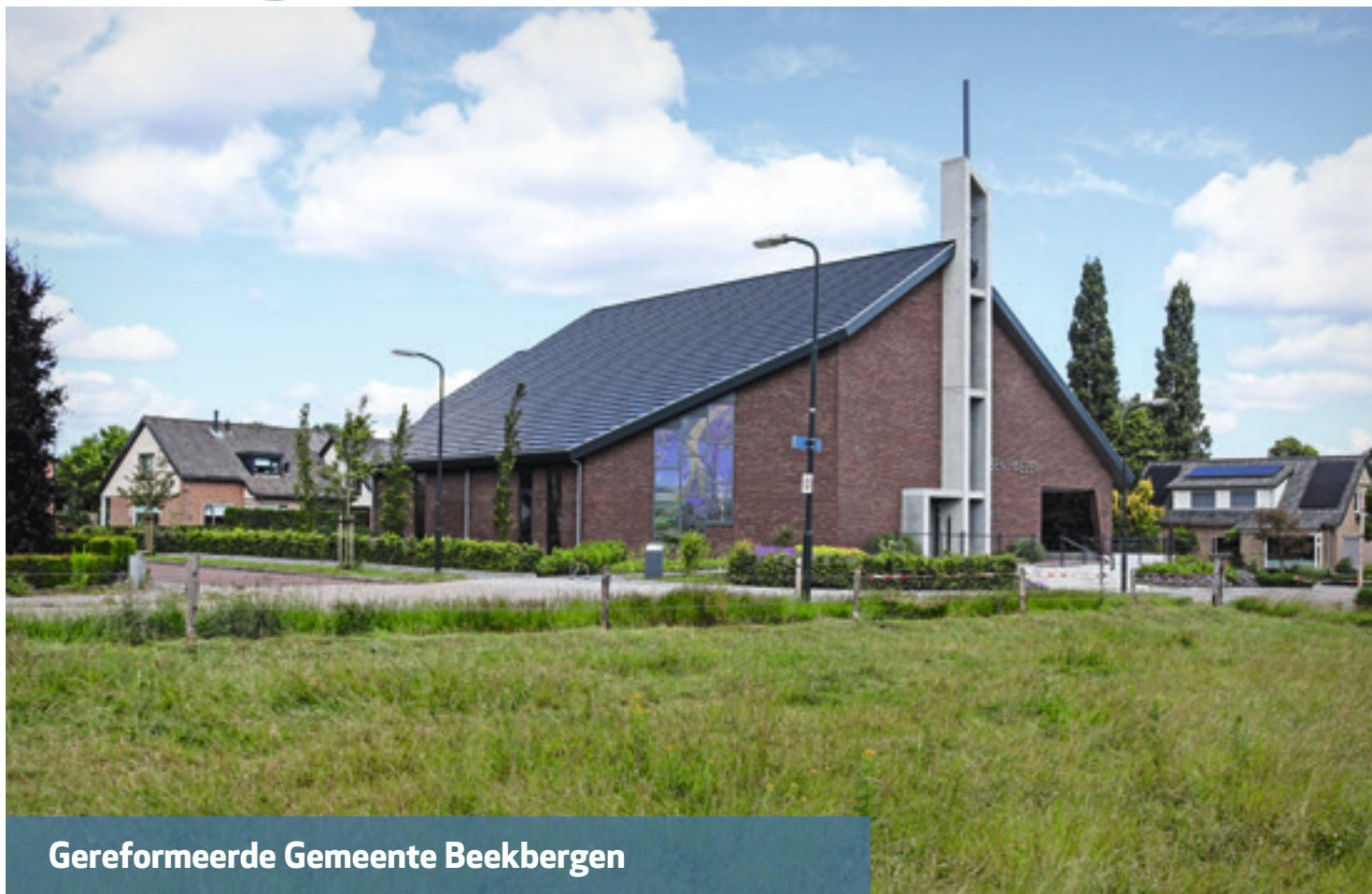
Gereformeerde Gemeente Beekbergen