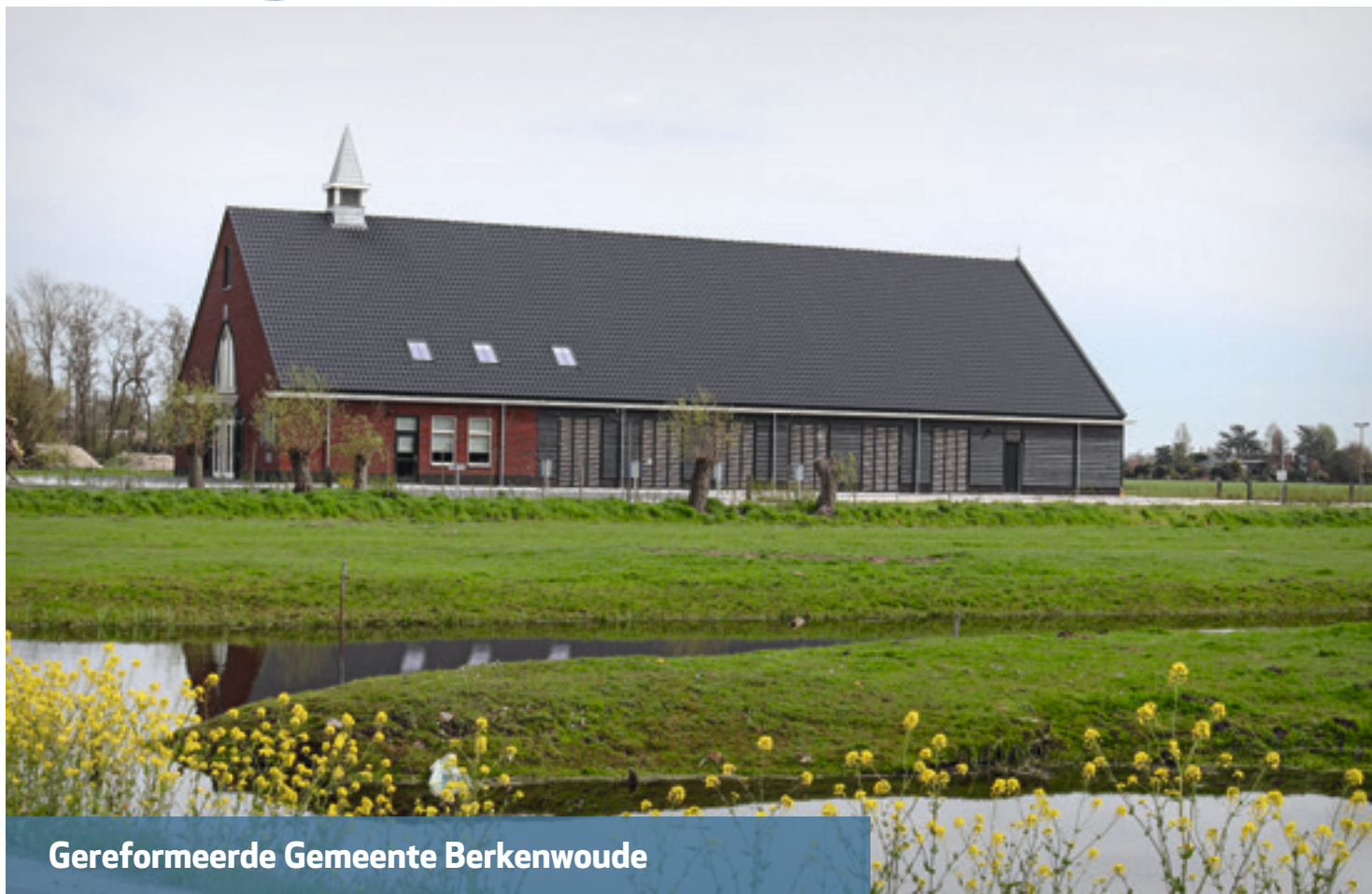
Gereformeerde Gemeente Berkenwoude