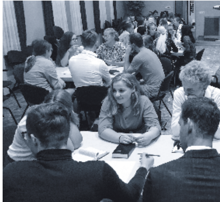
De meeste jongeren zijn gewend aan directe taal en willen eerlijk behandeld worden.

Aan het begin van dit jaar is het boekje "Naar de eis van hun weg" verspreid onder alle kerkenraden van de Gereformeerde Gemeenten. Dit boekje is een handreiking voor ambtsdragers in het omgaan met jongeren anno nu, geschreven door de Werkgroep Gezin. In vier artikelen vindt u de hoofdlijnen uit dit boekje, zodat u er als opvoeder(s) uw voordeel mee kunt doen. Deze week deel 1: Wie zijn onze jongeren?