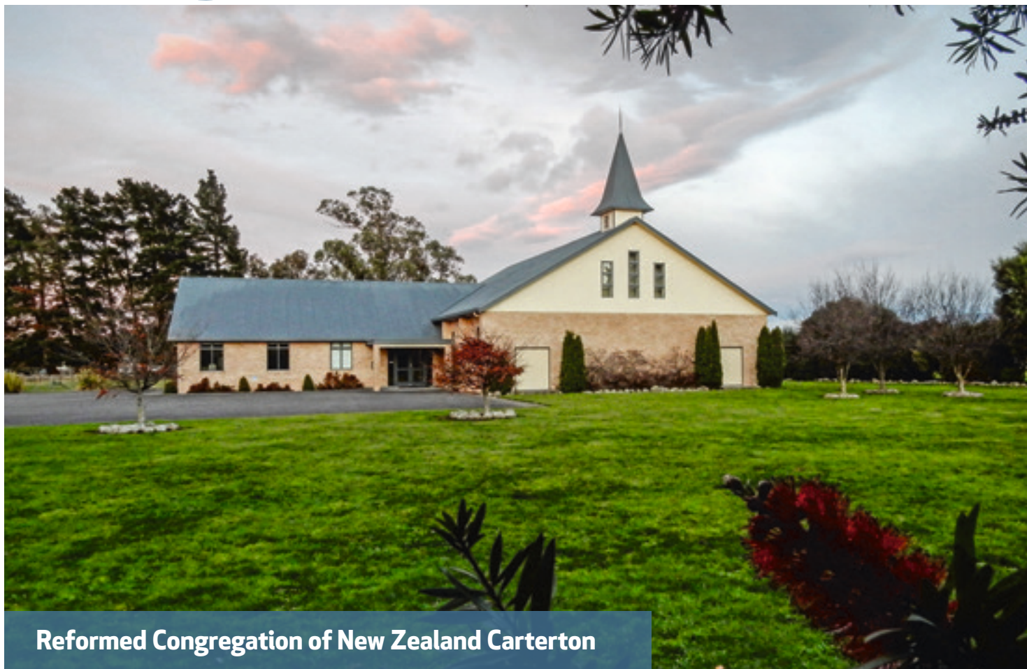
Reformed Congregation of New Zealand Carterton