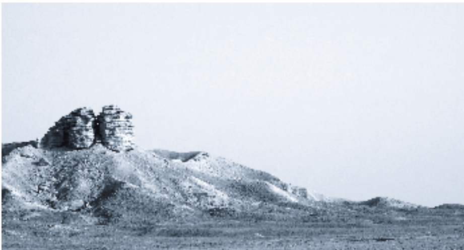
Voor zwervers op aarde zal de woestijnreis eens voorbij zijn.

Ontvang de hartelijke groeten uit een verland. Mocht u boven alles de nabijheid van Sions Koning ervaren tot uw sterkte en troost.