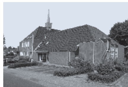
► Kerk Gereformeerde Gemeente Moerkapelle

Moerkapelle - Kerk Geref. Gemeente, zat. 14 jan., 19.30 uur, Sionskoor, kinderkoor Jonge Ichtusklanken, Joost van Belzen, orgel; collecte voor Helpende Handen.