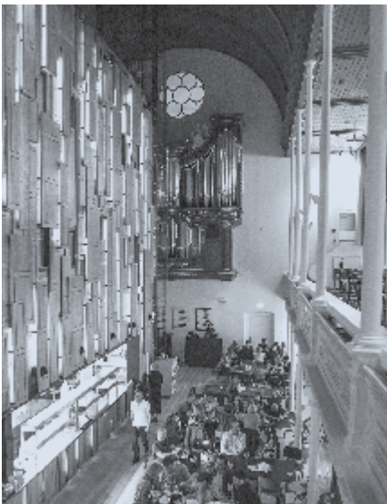
► In de voormalige Westerkerk in Utrecht is het orgel nog zichtbaar.

Laten we dankbaar zijn dat in de reformatorische traditie wordt gezegd dat je met het verleden verbonden bent door de belijdenisgeschriften. Mag het meer dan traditie zijn! ♦