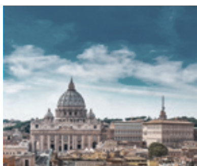
07 Benedictus XVI orthodox rooms