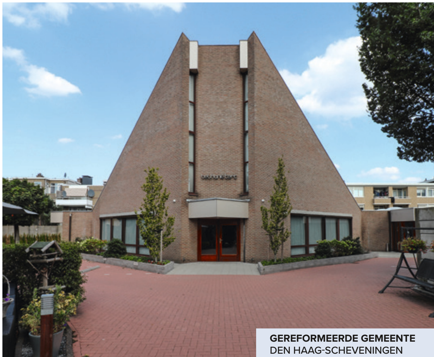
GEREFORMEERDE GEMEENTE DEN HAAG-SCHEVENINGEN