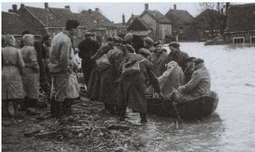
▶ Reddingswerk in Wolphaartsdijk.