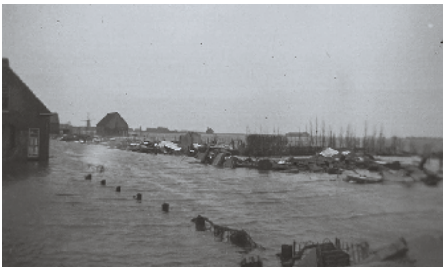
▶ Rechts van de molen het kerkje van Oude-Tonge. Aan die kant van de Julianastraat bleef verder bijna niets overeind.