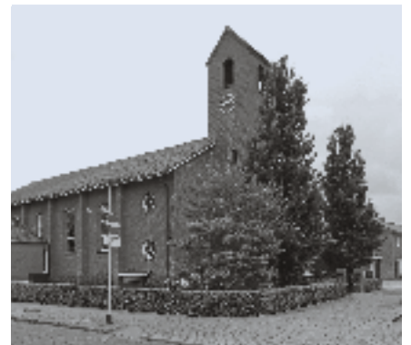
► Gereformeerde Gemeente Capelle a/d IJssel-West