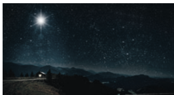
10 In de audiëntiezaal des Konings