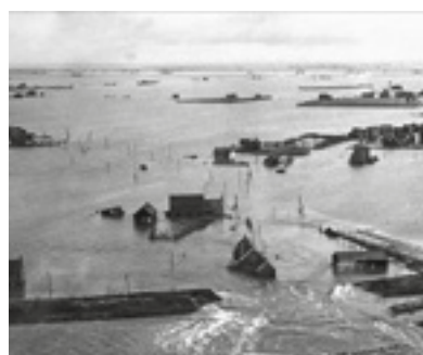
04 Watersnood 1953