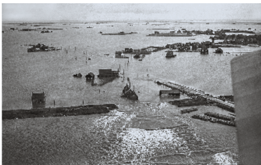
▶ Dijkdoorbraak tussen Oosterland en Nieuwerkerk.