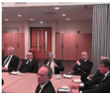
06 Terug op school