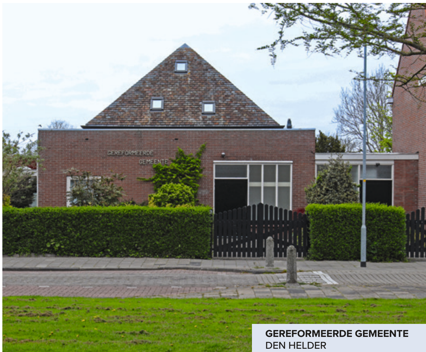
GEREFORMEERDE GEMEENTE DEN HELDER