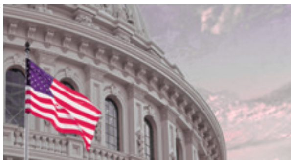
07 Christelijk nationalisme in VS