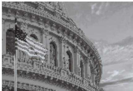
► Capitool met vlag.

Christelijke nationalist in Amerika laten steeds vaker van zich horen. Zij waren betrokken bij de bestorming van het Amerikaanse Capitool op 6 januari 2021. Tijdens de bestorming droegen zij 'Jezus redt'-spandoeken en houten kruizen. Zij voerden een soort kruistocht tegen de verkiezingsuitslag waarbij Donald Trump het veld moest ruimen. In de Amerikaanse commentaren werd het 'blank christelijk nationalisme' (WCN) verantwoordelijk gesteld, een beweging die steeds luider van zich laat horen. Uit hun programma blijkt dat zij willen strijden voor zaken waar wij veel begrip voor hebben. Te denken valt aan het kerstenen van openbare scholen en andere overheidsinstellingen, het terugdringen van abortus, het afnemen van LHBTI-vrijheden, het weren van moslimimmigranten, etc. We mogen dit streven zien als een reactie op de voortgaande secularisatie die het land in de greep heeft. De beweging van christelijke nationalist wordt verder gekenmerkt door een overdreven binding aan de natie en een stil verlangen naar blanke suprematie. Van deze gedachte is Trump een uitgesproken vertegenwoordiger. 'America first', was zijn verkiezingsleuze. Immigranten ziet