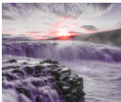
10 Serie: de wederkomst [4]