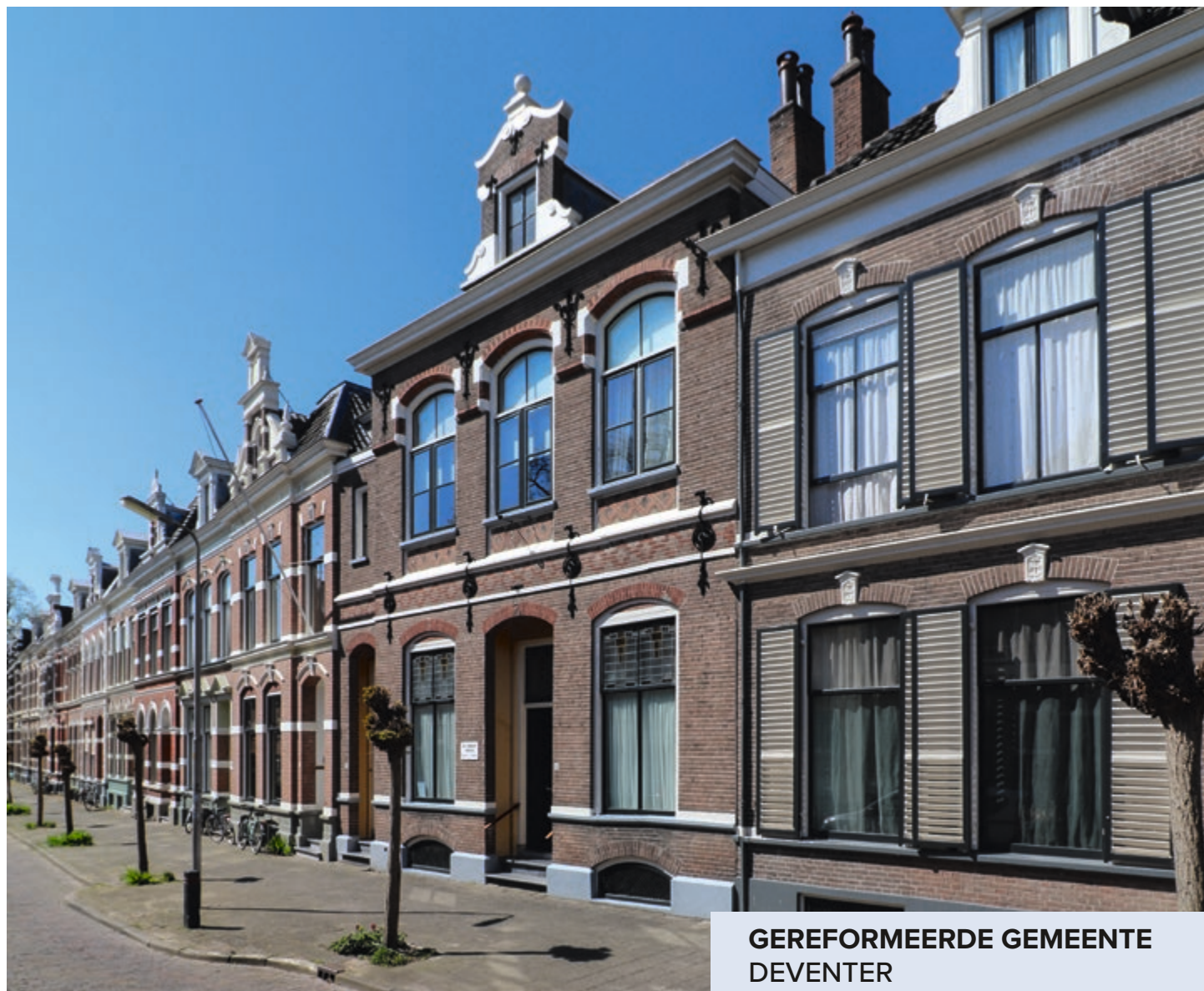
GEREFORMEERDE GEMEENTE DEVENTER