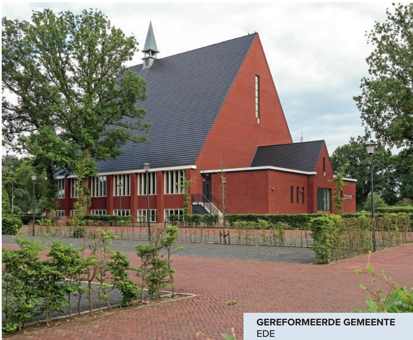
GEREFORMEERDE GEMEENTE EDE