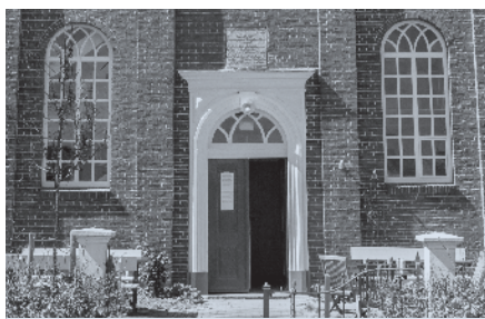
▶ Vooral in de tweede dienst op zondag worden lege plaatsen waargenomen.

Het is een illusie te denken dat door het sluiten van digitale kanalen wegblijvers weer naar de kerk zullen gaan. Niet alleen voor jongeren, maar voor iedereen is het nodig om er steeds weer op te wijzen dat het naar de kerk gaan de roeping is van elke christen. 'En laat ons onze onderlinge bijeenkomst niet nalaten, gelijk sommigen de gewoonte hebben, maar elkander vermanen; en dat zoveel te meer, als gij ziet dat de dag nadert' (Hebr. 10:25). De kanttekeningen spreken daarbij klare taal als zij over die gewoonte van sommigen zeggen dat zij in het bezoeken van de christelijke vergaderingen vertragen en van de waarheid afvalen door nalatigheid, of uit een groot gevoel van zichzelf of uit andere oorzaken. ♦