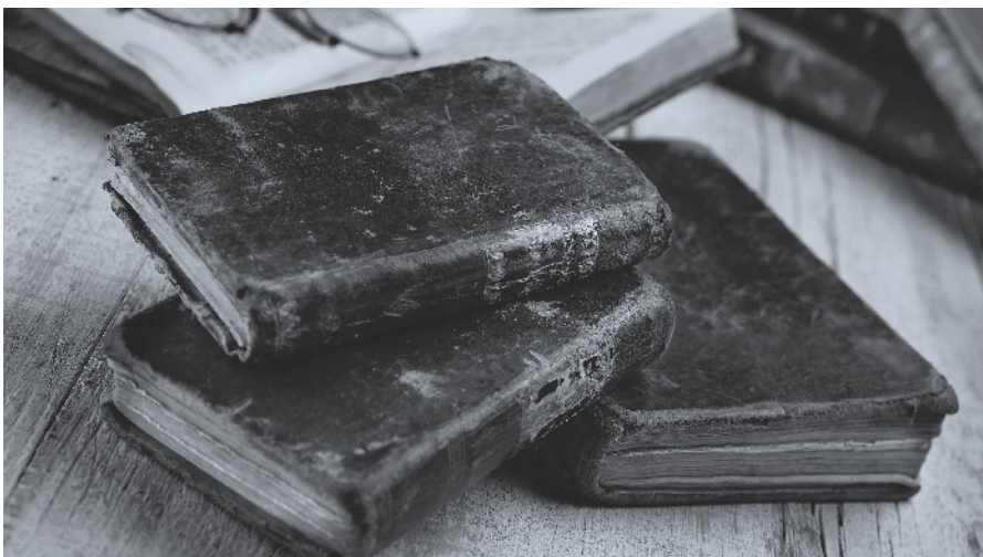
▶ De kritische methode om de Bijbel uit te leggen en de verlichte religieuze tolerantie voerden de boventoon.

Ondanks alle verschillen die er tussen onze tijd en de negentiende eeuw bestaan, kan het niet anders of we hebben ook de overeenkomsten opgemerkt. Ook onze tijd staat bol van de innerlijke tegenstrijdigheden. Bovendien spelen de beschreven historische processen tot op de dag van vandaag een rol in de samenleving en de tijdgeest. In een groot aantal opzichten zijn de overeenkomsten tussen het geestelijke/kerkelijke klimaat van de negentiende eeuw en onze tijd groter dan tussen de eerste helft van de twintigste eeuw en onze tijd. Het is onder andere om die reden dan ook raadzaam om enige kennis van de kerkgeschiedenis van de negentiende eeuw te hebben. We zijn dr. Fieret dankbaar dat hij in die leemte heeft willen voorzien. ♦