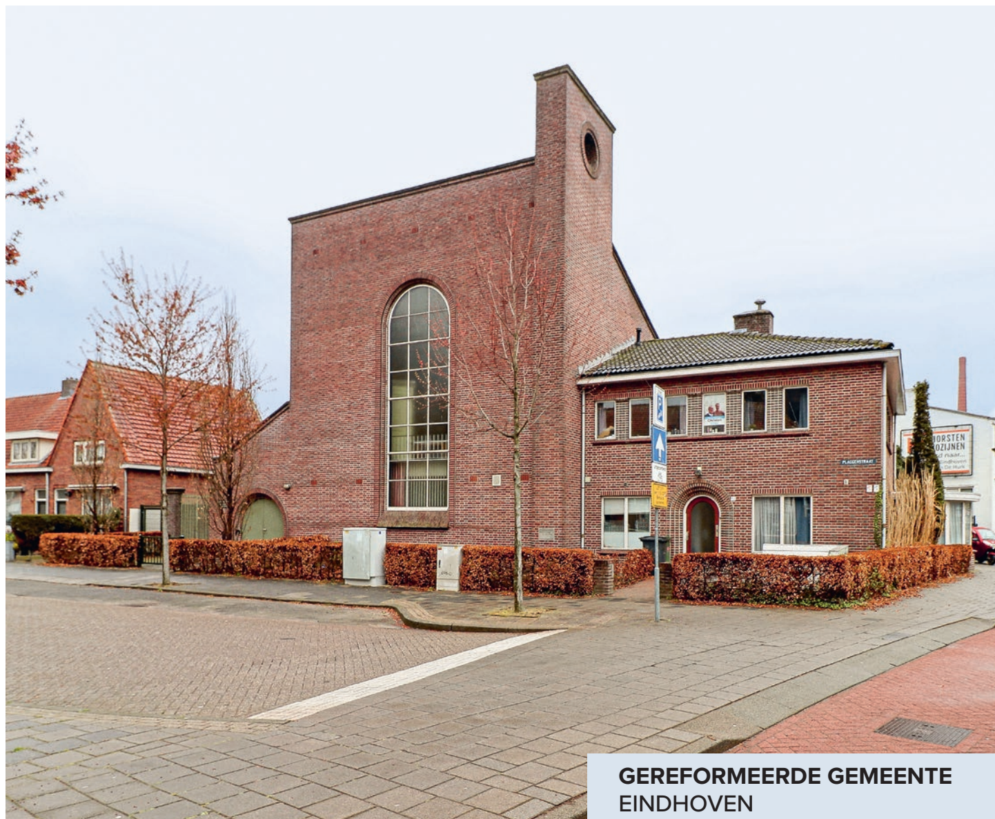
GEREFORMEERDE GEMEENTE EINDHOVEN