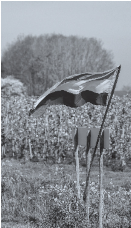
▶ De vlag is weer omgedraaid.

Maanden lang waren die vlaggen het symbool van protest. Tegen een regering die op verschillende dossiers het land volledig vast liet lopen. De ene maatregel was nog niet aangekondigd of hij ging al weer ondersteboven. Soms hadden boeren of burgers al goed ingespeeld op nieuwe wet- en regelgeving. Dat kostte nog weleens zwaar geld. Dan was het extra zuur als die wet- en regelgeving voor de zoveelste keer werd veranderd. Hoe moet je daar op reageren? Nou, door demonstraties te organiseren, door boosheid te ventileren, door vlaggen ondersteboven te hangen. O ja, en door te gaan stemmen op een partij die jouw boosheid het beste aanvoelt en verwoordt.