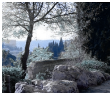
04 Het Pascha geslacht