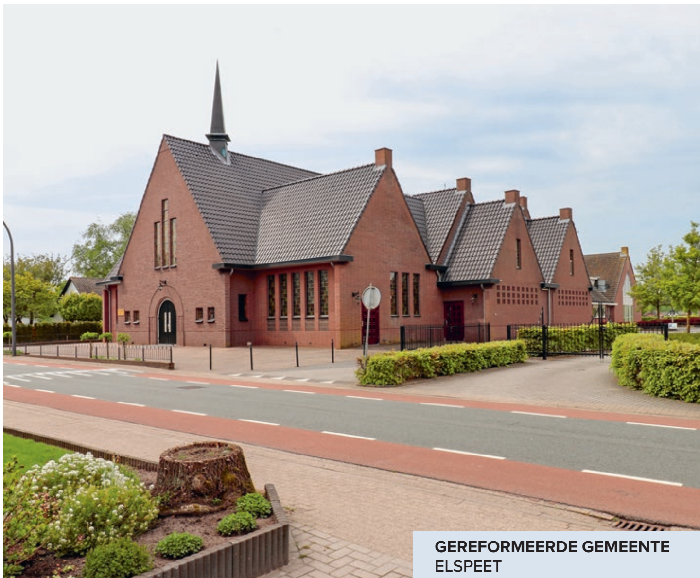
GEREFORMEERDE GEMEENTE ELSPEET