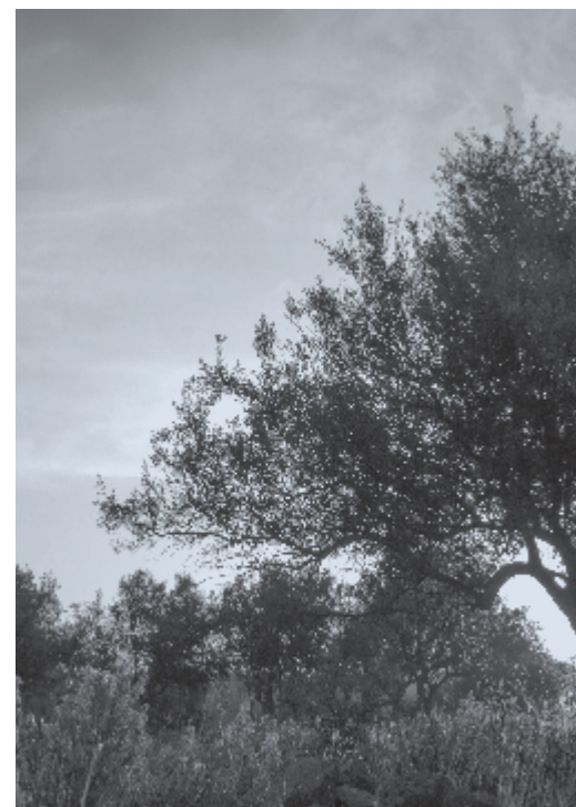
► In het donkere Gethsémané daalt een engel af.

Het is nacht. En Jezus is alleen. Eerst heeft hij acht discipelen achtergelaten. Met Petrus, Johannes en Jakobus heeft Hij Zich verder teruggetrokken in de tuin. Toen heeft Hij ook die drie laatste vrienden verlaten en Zich verborgen in het donker. Dit wordt een nacht vol eenzaamheid. De aarde gaat Hem uitwerpen buiten de legerplaats. Straks gaan de werkers van het kwaad Hem afmatten, afbeulen en wégdoen, doorverwijzen naar de executieheuvel, Hem hangen aan een paal in de grond. Straks zal het stierenheir uit Basan deze Man van smarten wreed naar het leven staan en letterlijk van de wereld afdrukken, uitwissen als een voetspoor in