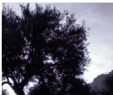
06 Een engel in de olijvenhof