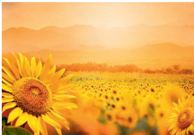
M. Snellen-Nijsink, Veenendaal

(leg eens uit: waarom past dit gedeelte bij het stukje hierboven?)