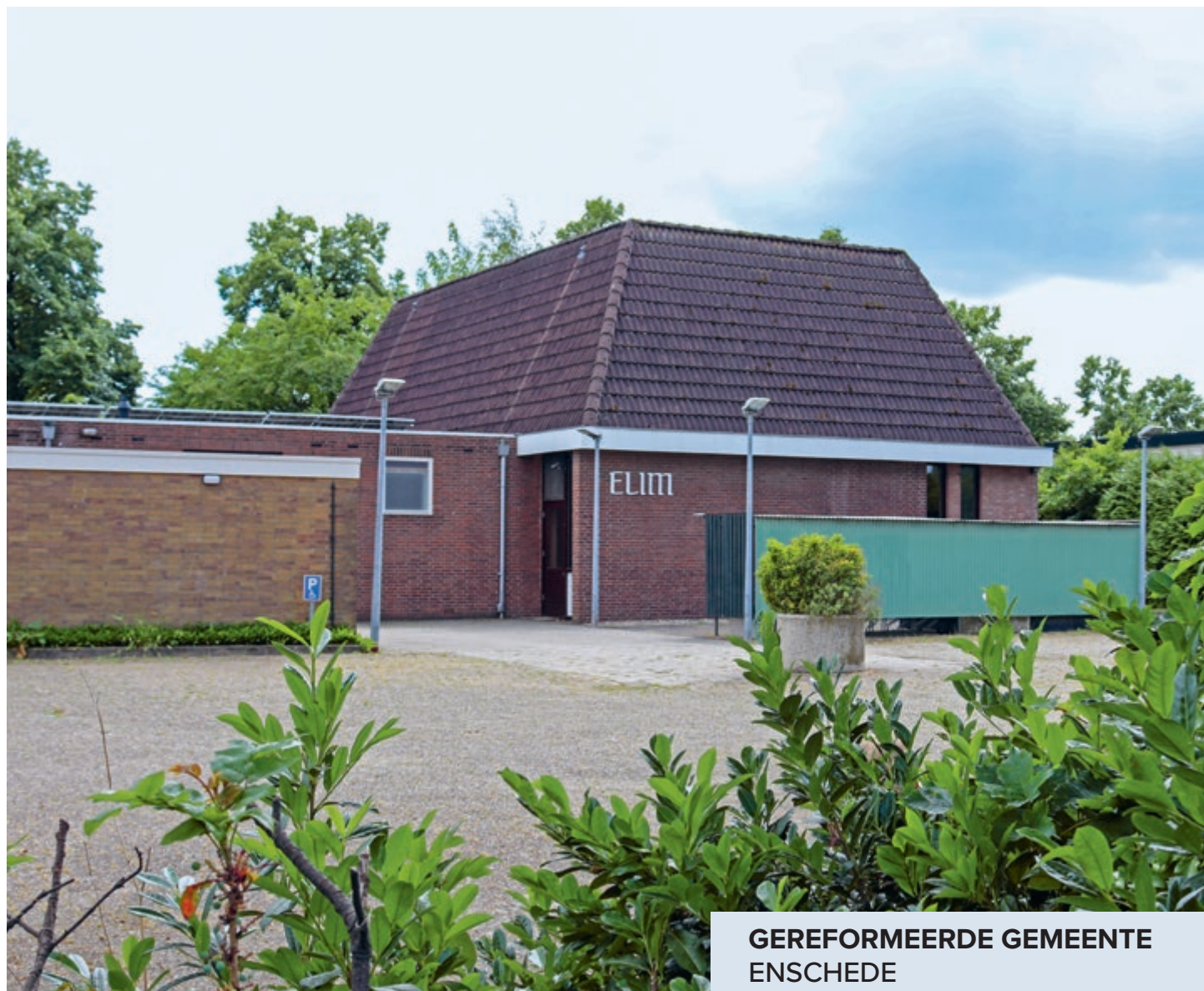
GEREFORMEERDE GEMEENTE ENSCHEDÉ