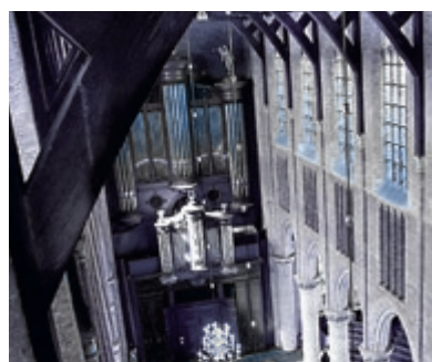
07 Vertrouwen in de kerk