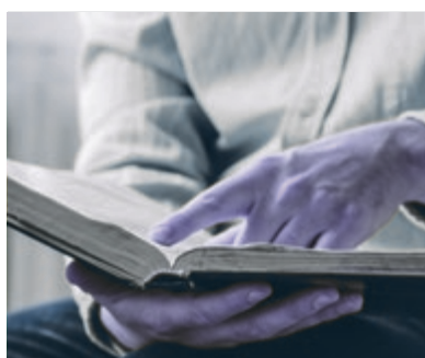
08 Lezen en luisteren