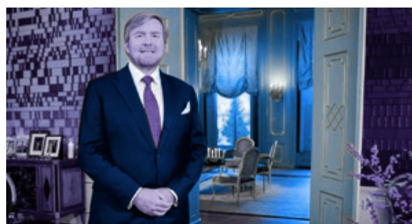
05 Koning Willem-Alexander jarig