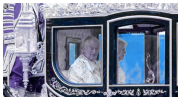
09 Commentaar: God save the king