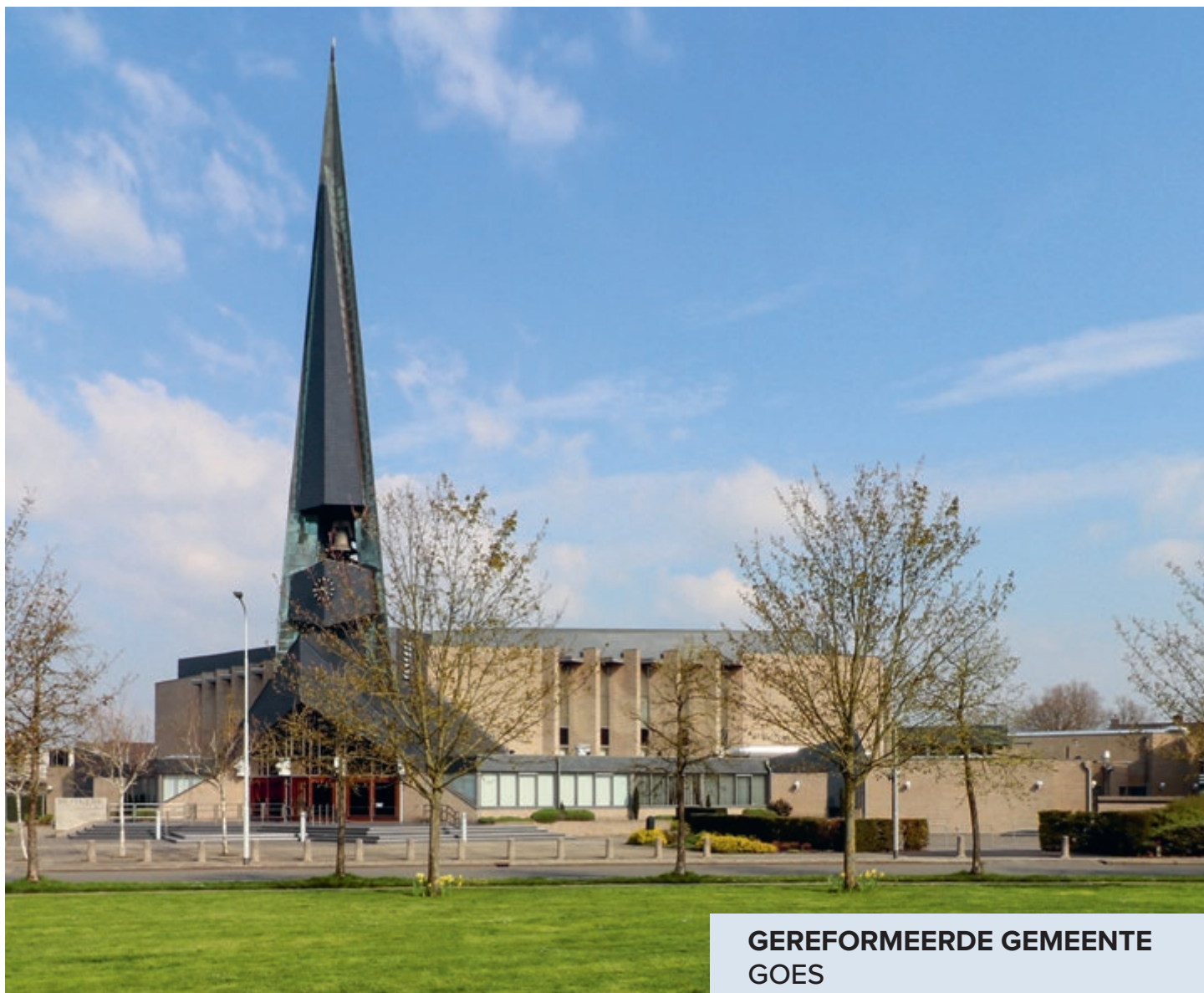
GEREFORMEERDE GEMEENTE GOES