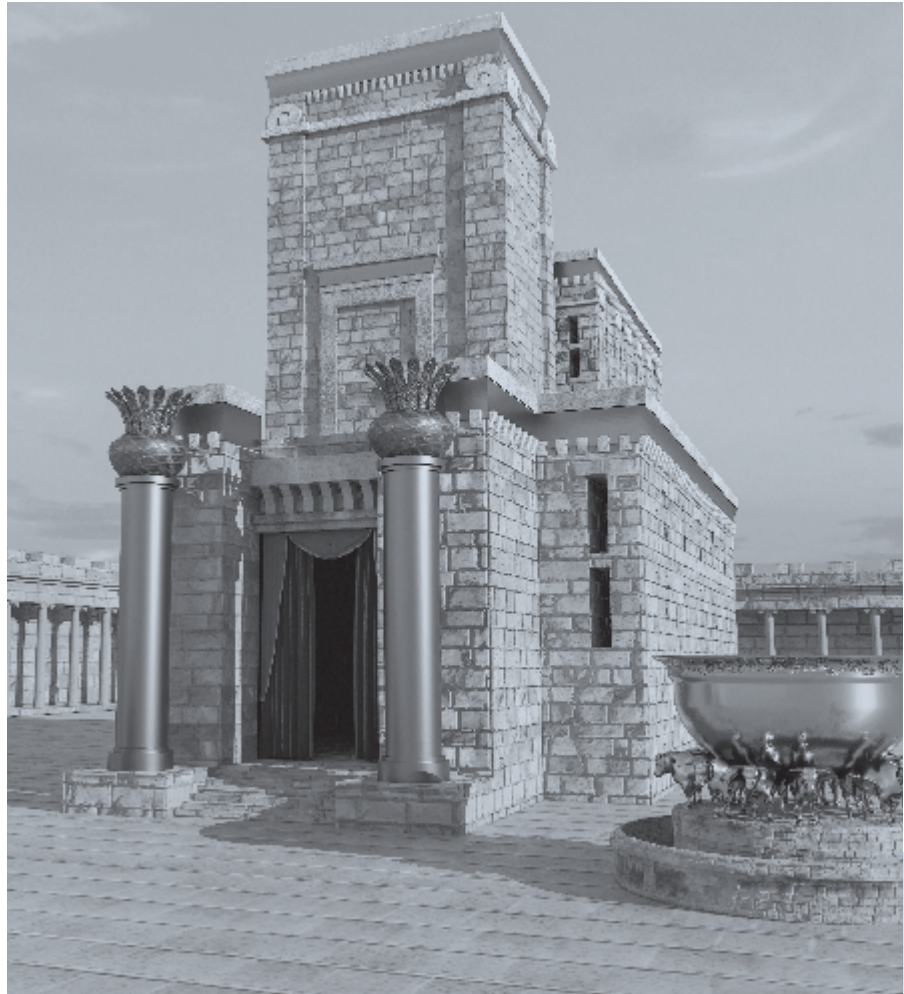
▶ De deuren van Jeruzalem werden wijd opengezet toen de ark aankwam. Zo werden de poorten van de hemel wijd geopend voor Christus.

De deuren van Jeruzalem werden wijd opengezet toen de ark aankwam. Zo werden de poorten van de hemel wijd geopend voor Christus. Toen Adam met Eva het eerste verbond verbrak, werden de hemelpoorten voor Adam en al zijn nakomelingen gesloten en vergrendeld. Ze zouden naar recht voor eeuwig gesloten blijven. Maar nu komt de Verbondsgod, de Hemelvaartskoning, en de poorten gaan open: 'Verhoogt, o poorten, nu de boog; rijst, eeuw'ge deuren, rijst omhoog; opdat de Koning in moog' rijden'.