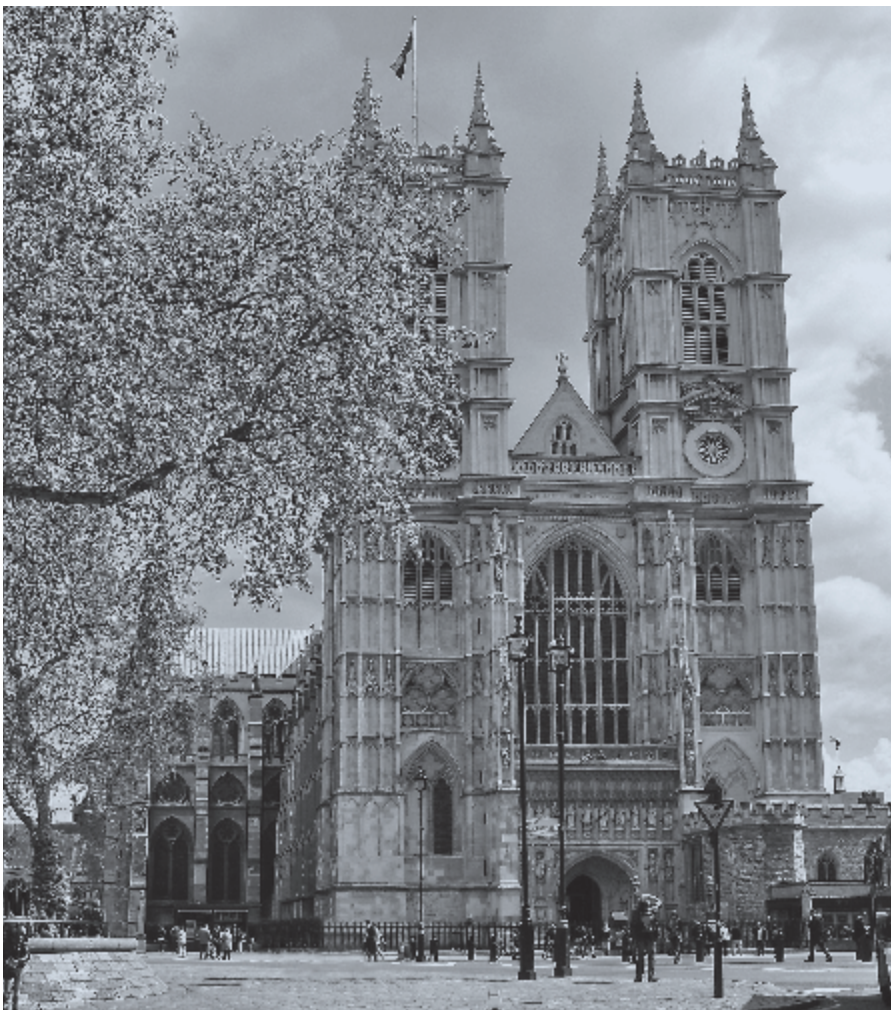
▶ De Westminster Confessie werd in 1646 opgesteld in Westminster Abbey in Londen.

Welke plaats heeft deze ten hemel Gevarene nu in uw leven en uw gebed? ♦