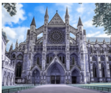
04 Westminster Confessie