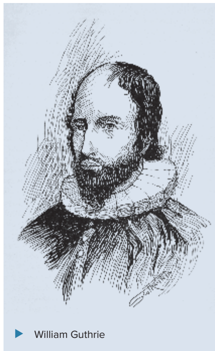
▶ William Guthrie