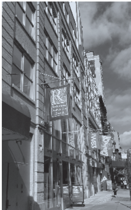
▶ Redeemer Church New York