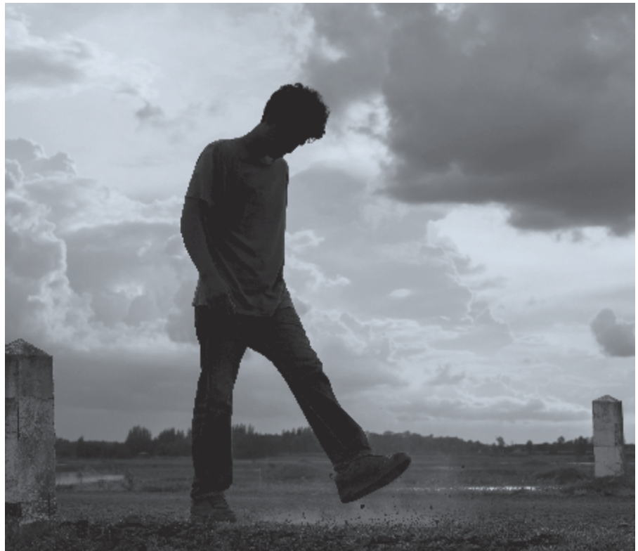
► Het mentale welbevinden van jongeren gaat achteruit.

Dit artikel is met toestemming overgenomen uit De Wachter Sions, kerkblad van de Gereformeerde Gemeenten in Nederland.