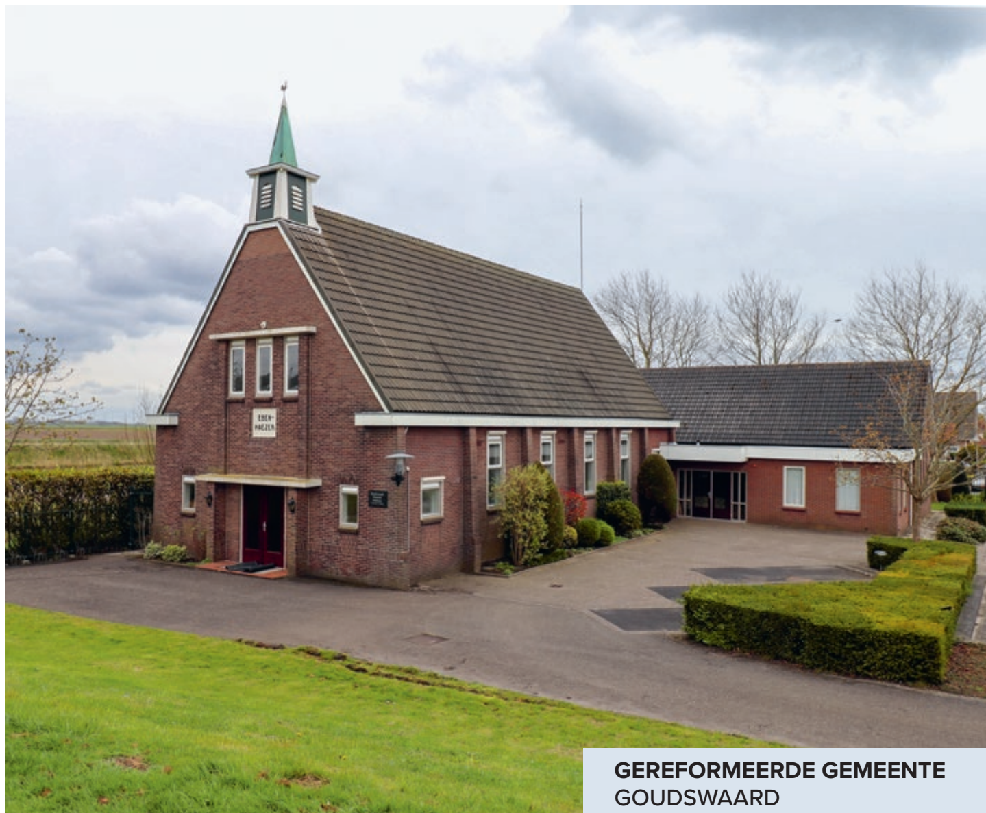
GEREFORMEERDE GEMEENTE GOUDSWAARD