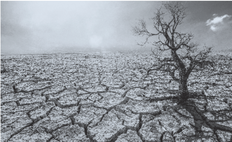
► 'Heere, wij hebben deze droogte verdiend'.

Het is in de zomer van 1904. Al weken valt er geen druppel regen meer. De sloten staan droog en het gras is geel en verdord.