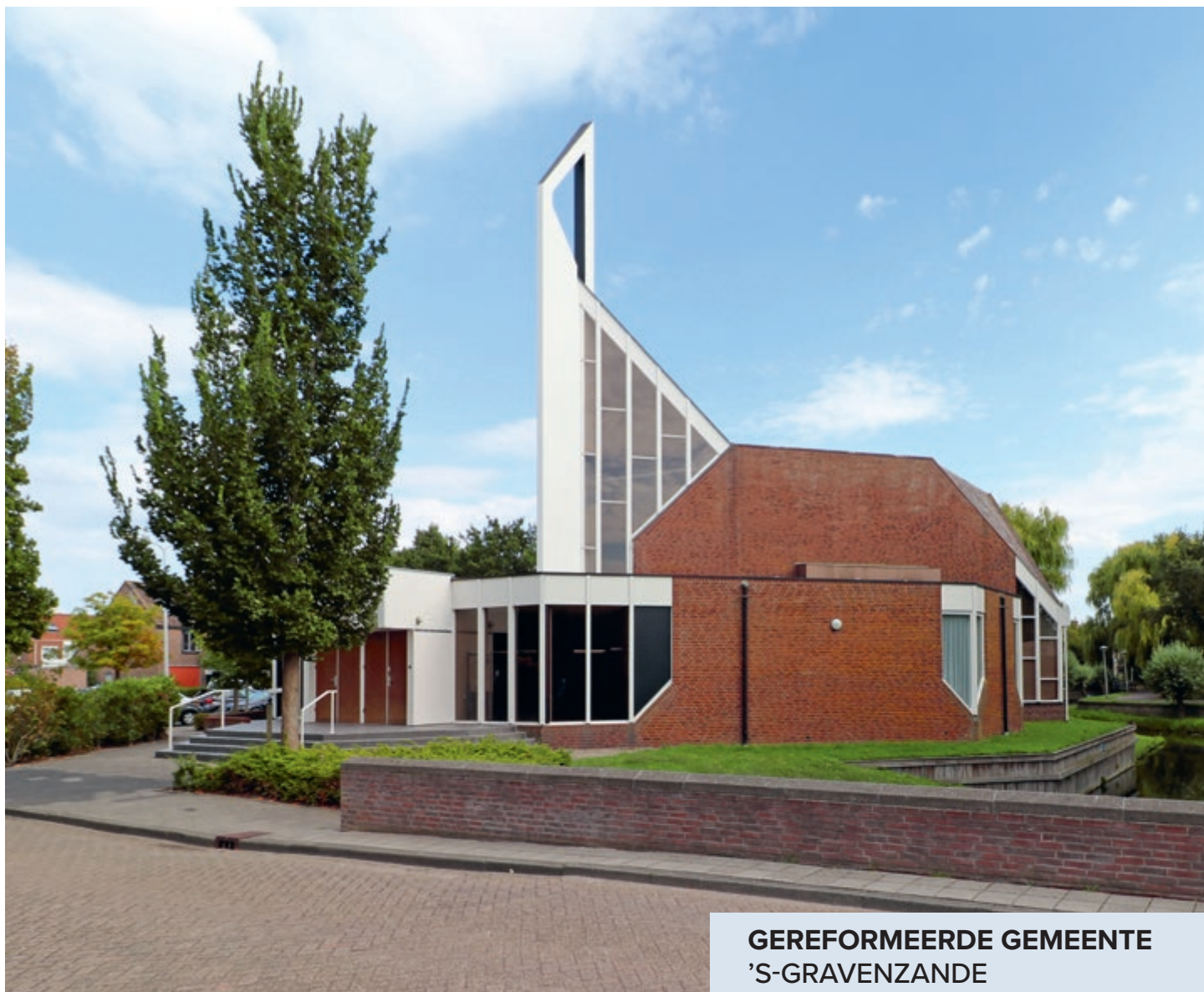
GEREFORMEERDE GEMEENTE 'S-GRAVENZANDE