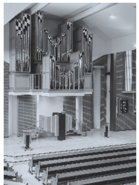
► De koster zorgt voor een goed verloop van de eredienst.

Eén dag is in Uw huis mij meer Dan duizend waar ik U ontbeer; 'k Waar' liever in mijns Bondsgods woning Een dorpelwachter, dan gewend Aan d' ijd'le vreugd in 's bozen tent. ♦