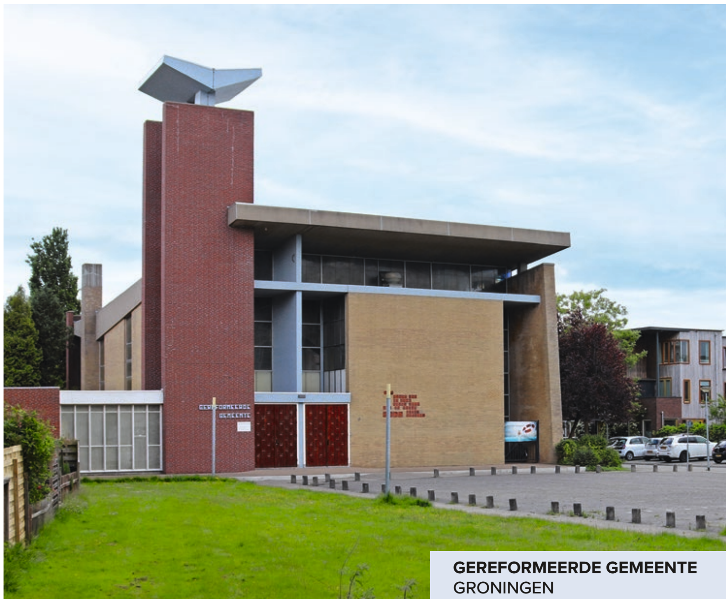
GEREFORMEERDE GEMEENTE GRONINGEN