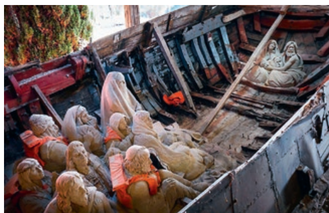
P.C. Beeke, Middelburg