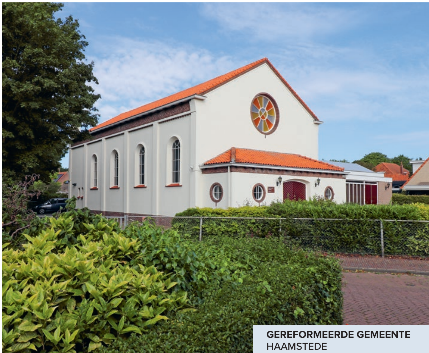
GEREFORMEERDE GEMEENTE HAAMSTEDE