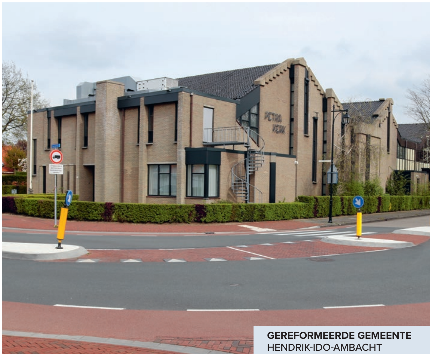
GEREFORMEERDE GEMEENTE HENDRIK-IDO-AMBACHT