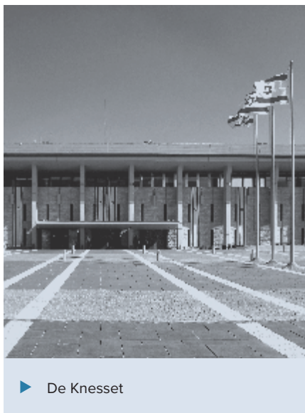
► De Knesset

Het is niet gemakkelijk om deze gebeurtenissen Bijbels te duiden. Wordt Israël door deze hervormingen meer en meer een ultraorthodoxe staat of zal het zich ook sterk roerende seculiere deel uiteindelijk de overhand