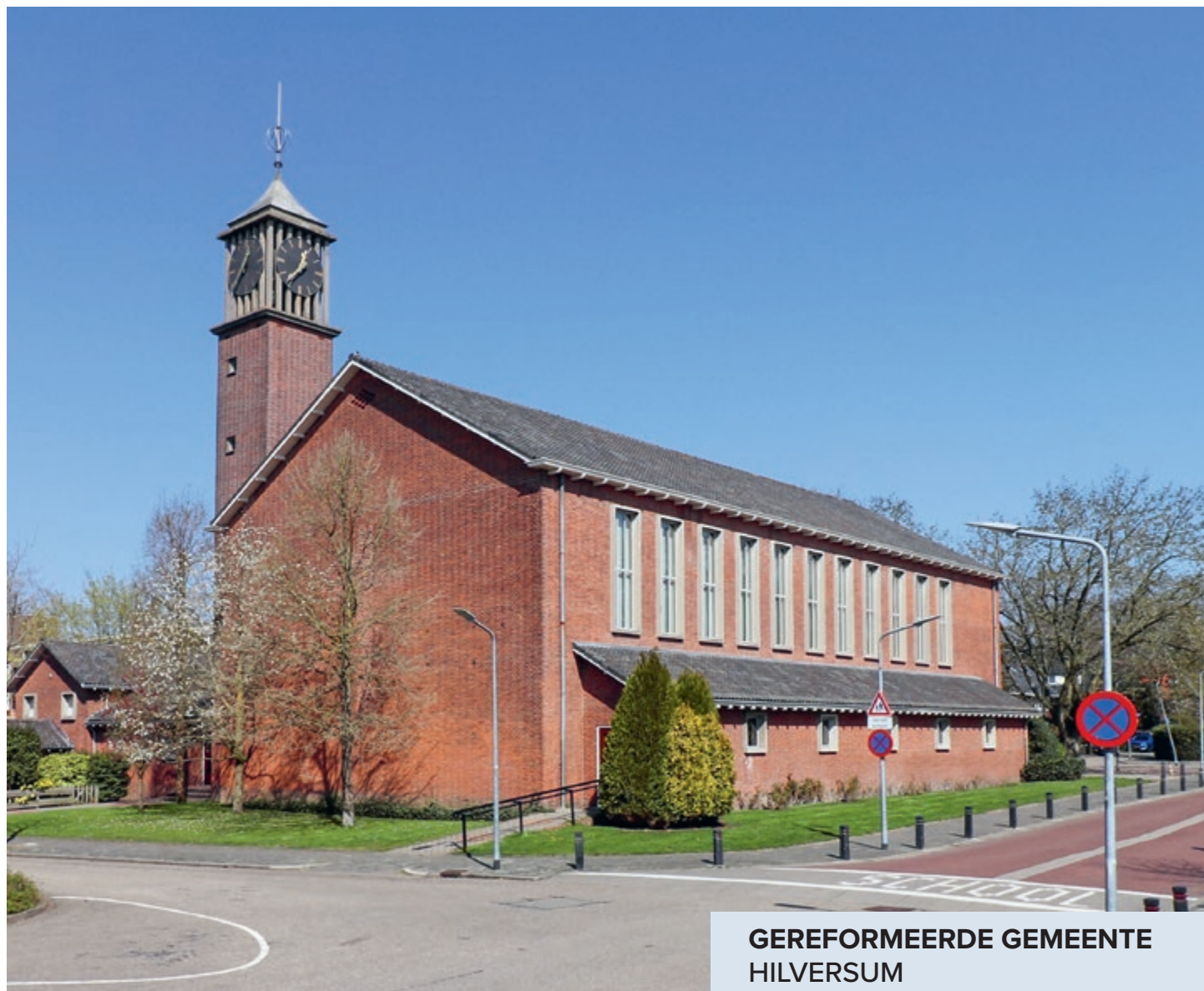
GEREFORMEERDE GEMEENTE HILVERSUM