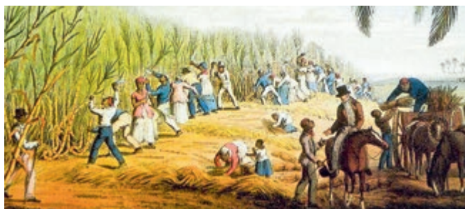
P.C. Beeke, Middelburg