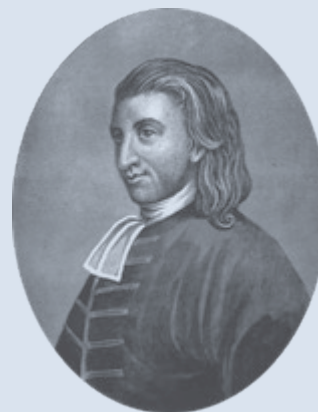
THOMAS BOSTON (1676-1732)

Heeft Christus op uw dode en dorre beenderen geblazen? Of bent u nog steeds gespeend van geestelijk leven? Vergaat u in uw ongerechtigheid? Wat hebt u hierop te zeggen? Als u nog steeds in de dood ligt, is uw toestand beklagenswaardig. Maar als u leeft, welke levenstecken zijn er dan in u te vinden? Ik sta daarover zelf wel in twijfel, vanwege de heersende verdorvenheid. Laten we dus eens zien wat ik hierop kan zeggen. Wie de Geest heeft, heeft het leven (Rom. 8:2, 9). Nu geloof ik dat ik de Geest heb; ergo, ik heb leven. Dat ik de Geest heb, stel ik vast op grond van het volgende: Ik heb licht dat ik eenmaal niet bezat. Ik zie nu anders dan vroeger. Eens was ik blind, maar