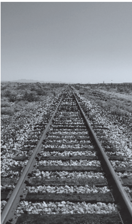
▶ Er liggen brokstukken op het spoor

Voor zover mogelijk wil ik hier open in zijn. Want de pijn van wat onlangs bekend en bericht werd, wordt niet alleen door ondergetekende gevoeld. Niet in het minst zal dat ook het geval zijn bij onze broeder die jarenlang deze rubriek heeft verzorgd. De lezer zal begrijpen dat het dan ook met schroom en pijn is om verder te gaan met 'Van overzee'.