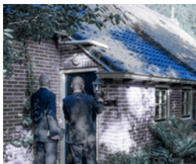
04 De hand aan de ploeg