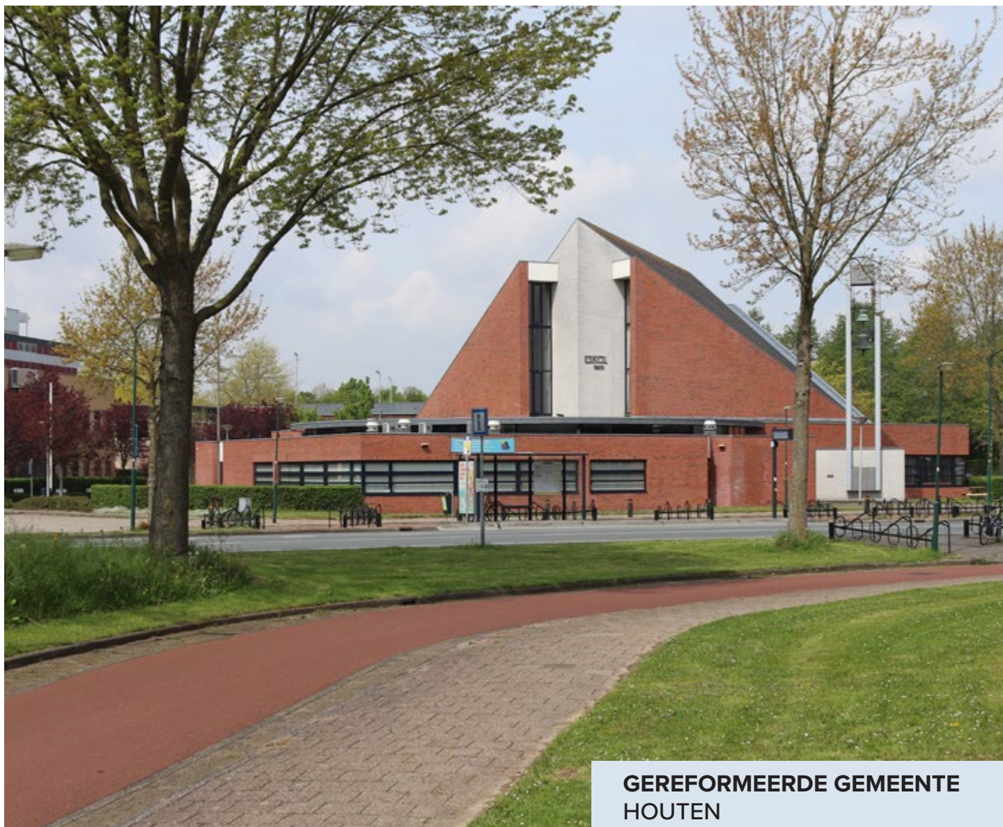
GEREFORMEERDE GEMEENTE HOUTEN