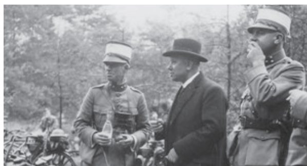
10 Meester, predikant, politicus