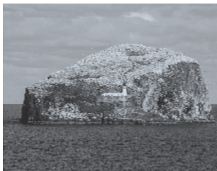
▶ Bass Rock