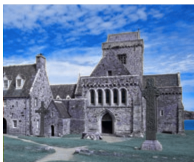
07 Van Iona tot Bass Rock