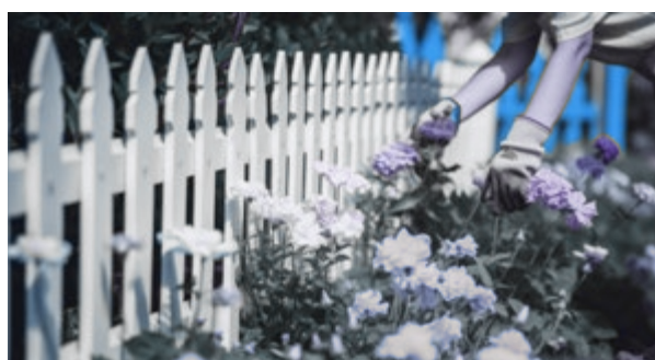
12 Je huwelijk... een bloementuin