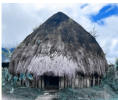
09 De einden der aarde