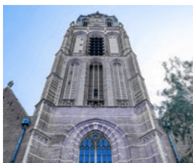
08 Hellenbroek als prediker