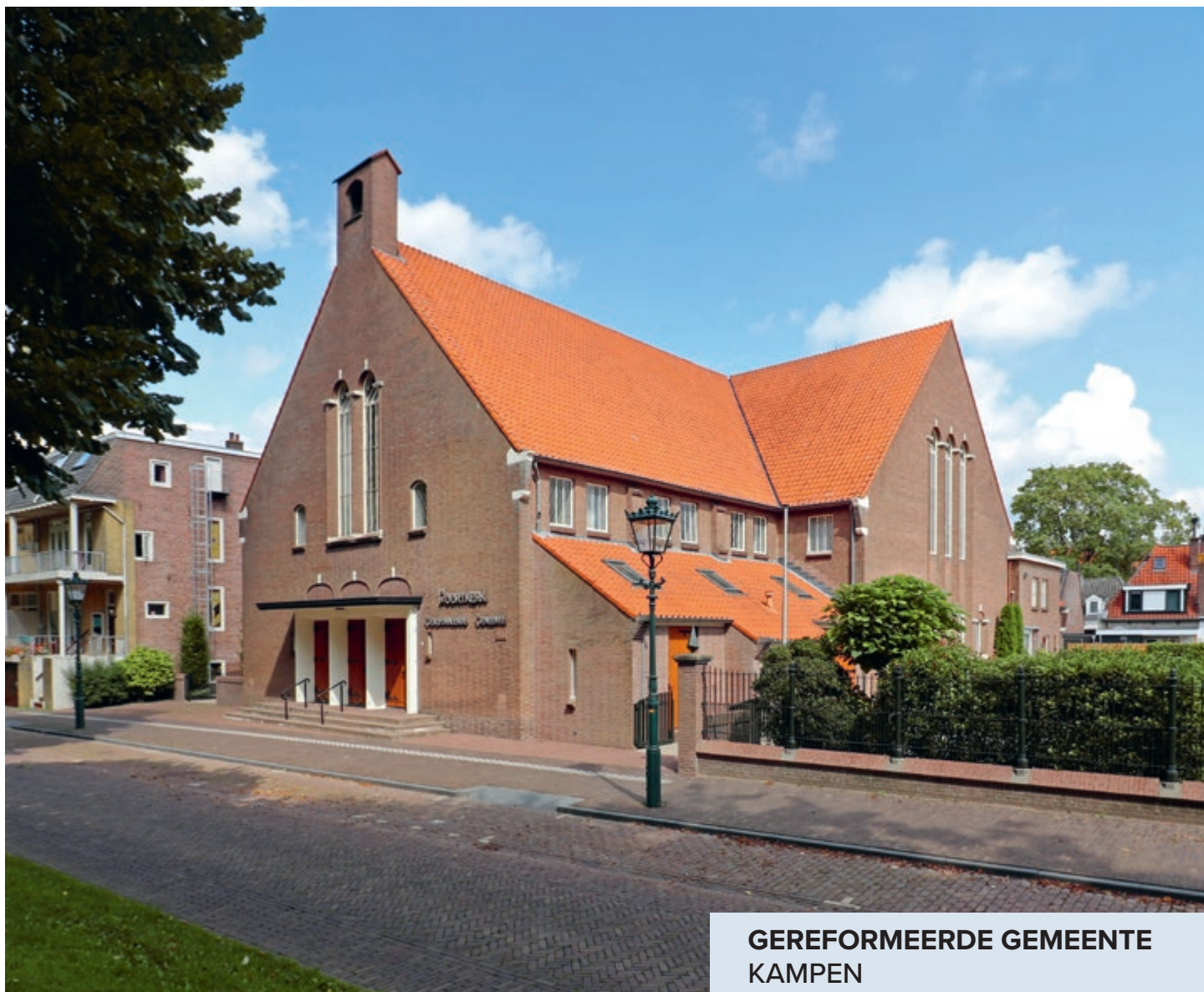
GEREFORMEERDE GEMEENTE KAMPEN