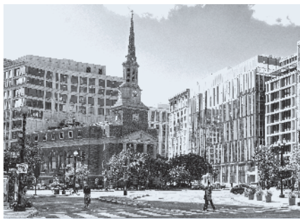
▶ Amerika was een christelijk land in de brede zin van het woord.

Sommige godsdienstsociologen zochten de verklaring van deze uitzonderingssituatie met name in het grote aantal godsdienstige alternatieven dat je in Amerika vindt. De kerkelijke verscheidenheid is daar nog veel groter dan bij ons. Allerlei groepen emigranten brachten immers hun eigen kerken mee. In Amerika ontstonden ook nieuwe religieuze bewegingen als de mormonen en de pinksterbeweging. Als gevolg daarvan was er op godsdienstig gebied keus genoeg. Iedereen kon wel een kerk of samenkomst vinden waar de boodschap en de aankleding van de eredienst hem aansprak en waar hij zich helemaal thuis kon voelen. De vele alternatieven stimuleerden kerken ook om hun samenkomsten zo aantrekkelijk mogelijk te maken. Voorgangers leken soms op religieuze ondernemers die in een aantal gevallen zelfs megakerken exploiteerden.