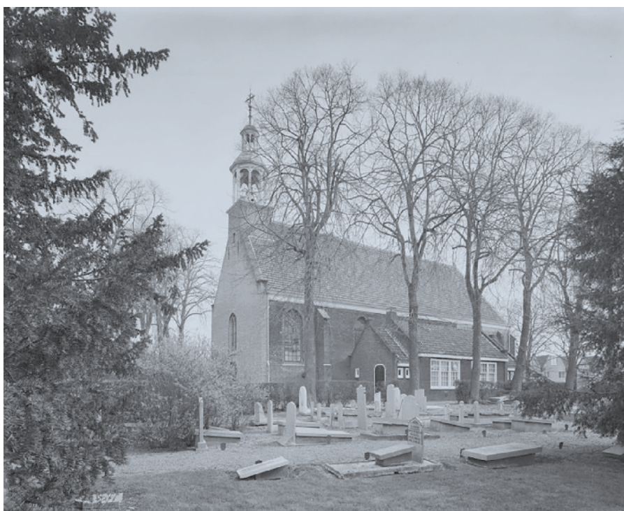
► In Zwijndrecht maakte Hellenbroek veel werk van zijn catechisatielessen. Foto: de Oude Kerk van Zwijndrecht.