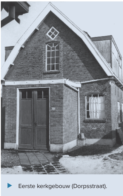
▶ Eerste kerkgebouw (Dorpsstraat).