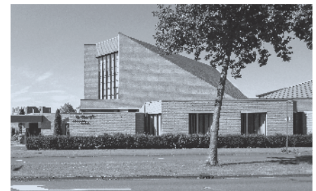
▶ Derde en huidige kerkgebouw (Zwaardslootseweg).