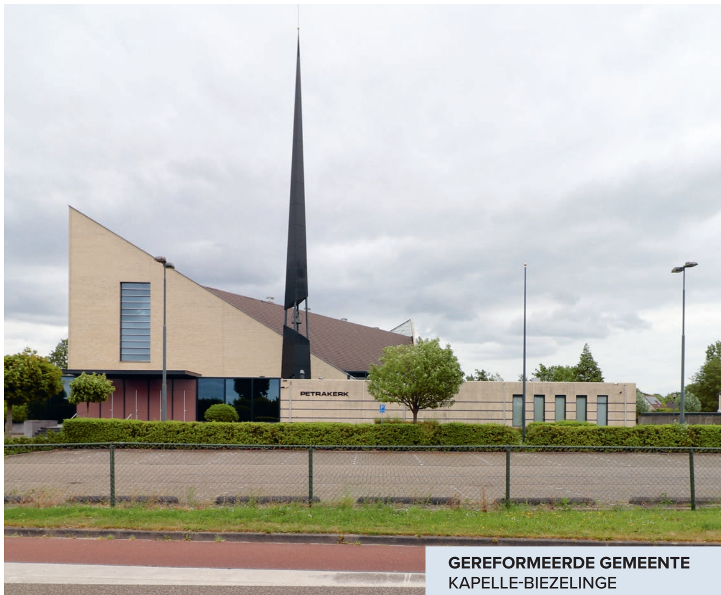
GEREFORMEERDE GEMEENTE KAPELLE-BIEZELINGE