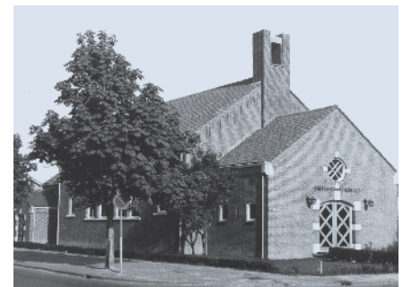
▶ Tweede kerkgebouw (Piet Heinplein).

Op 5 oktober wordt in een herdenkingsdienst stilgestaan bij het jubileum. Er wordt een jubileumboek uitgegeven met als titel ‘De stedelingen zullen bloeien’. ♦