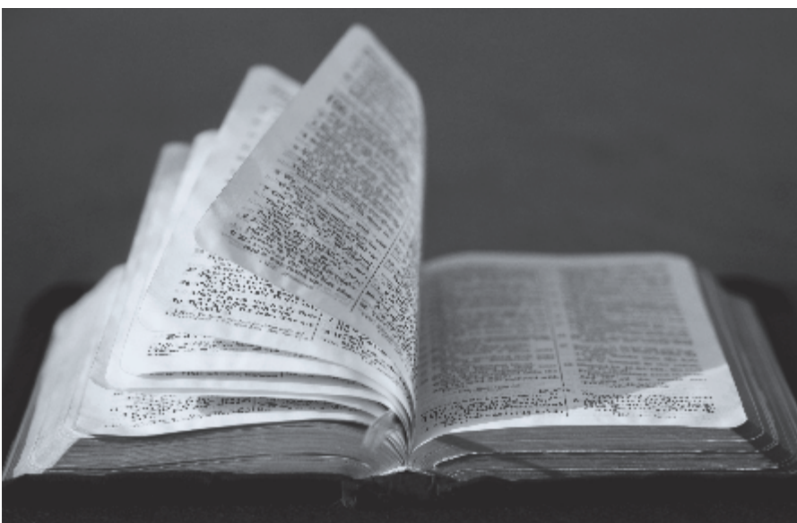
► 'De Zoon is het Woord, de Wijsheid en het beeld des Vaders' (uit artikel 8, Nederlandse Geloofsbelijdenis).

Het is dus kenmerkend voor de Heilige Geest dat Hij altijd aanwerkt op de eer en het recht van God de Vader. Ook is het kenmerkend voor de Geest dat Hij nooit rust gunt buiten de Zoon en Zijn middelaarsheerlijkheid. Zo zijn de Geesteswerkingen te onderscheiden en te gevoelen. Op deze manier wordt ook het vervolg van het geloofsartikel duidelijk. 'Zo is het dan openbaar dat de Vader niet is de Zoon, en dat de Zoon niet is de Vader, dat ook insgelijks de Heilige Geest niet is de Vader, noch de Zoon'. Daarom wordt de Heilige Geest wel vergeleken met iemand die met een