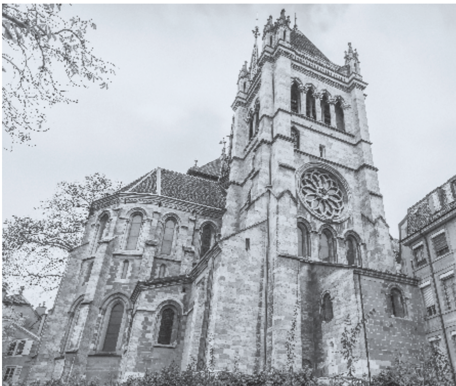
► De Saint-Pierre in Genève, de kerk van Johannes Calvijn.