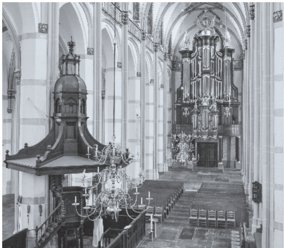
► Zaltbommel was de derde gemeente van Hellenbroek. Foto: de Maartenskerk.