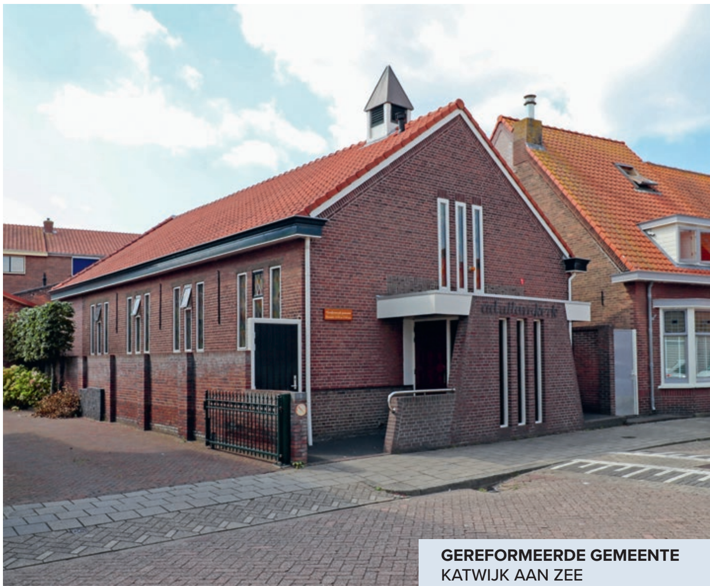
GEREFORMEERDE GEMEENTE KATWIJK AAN ZEE