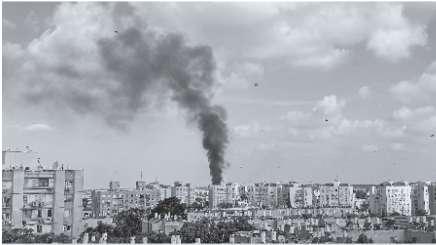
► Het was sabbat in Israël, net na de herinnering aan de Jom Kippoer-oorlog. Foto: Hamas raket valt op Beer Sheba, 7 oktober.

Er zijn schaapherders en boeren die ervan weten. Nu de wolf zich in ons land aan het settelen is, wordt hun vee soms aangevallen. Dat beest grijpt zijn prooi, maar soms is één dood dier niet genoeg. Dan wordt een groot deel van een kudde schapen gewoon afgeslacht.