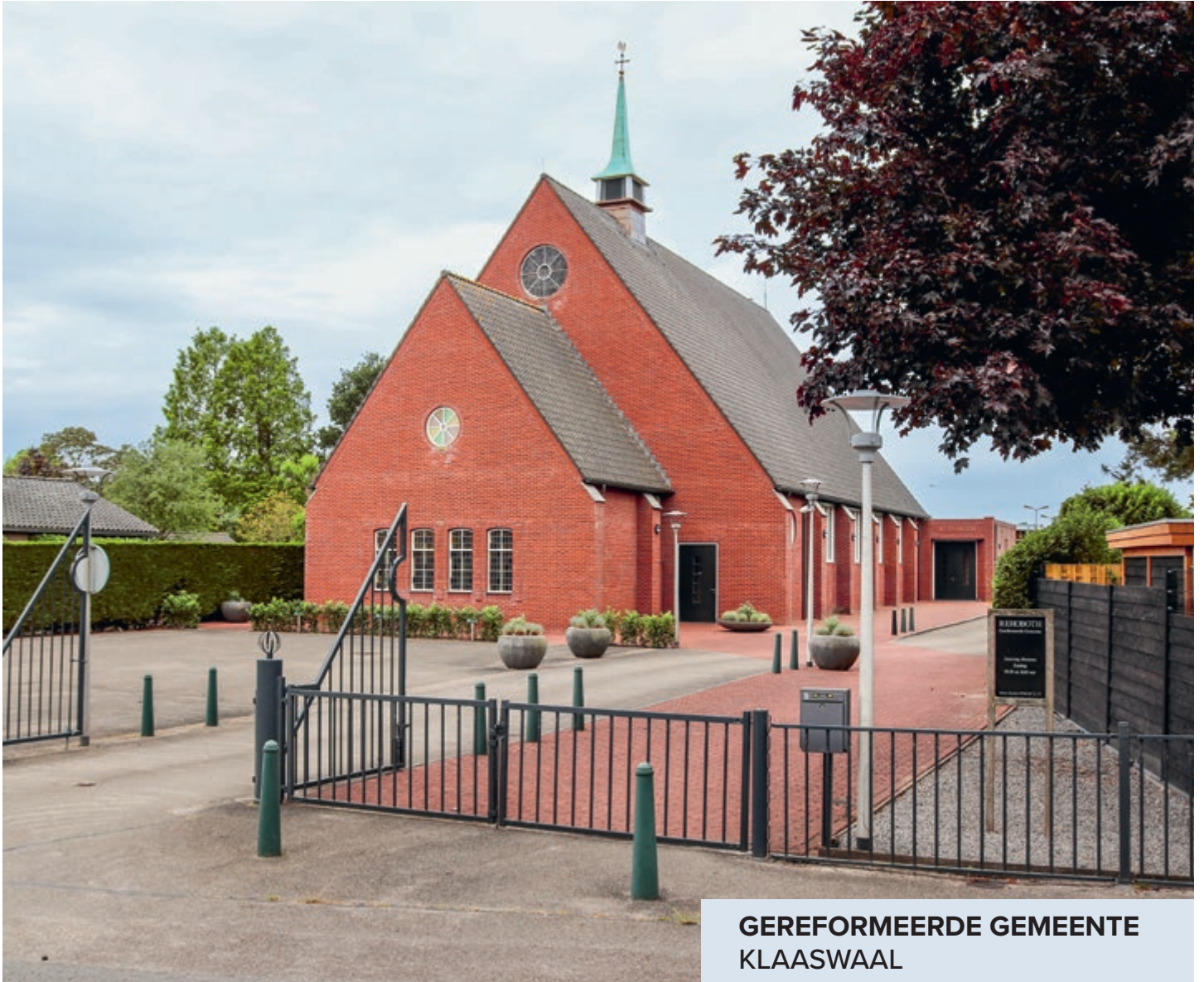
GEREFORMEERDE GEMEENTE KLAASWAAL