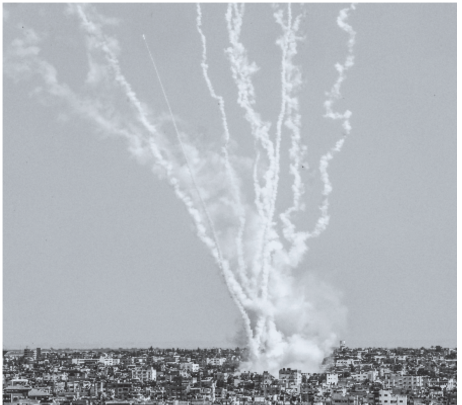
► Bid voor het volk, bid voor de soldaten, voor de overheid. Bid voor het Palestijnse volk. Bid voor de Hamas, dat ze de Vrededorst mogen leren kennen. Foto: lancering van raketten vanuit Rafah richting Israël, 7 oktober.

Die mooie technologische kennis waar we zo dol op zijn, die hielp ons niet tegen de vijand: de bewakingscamera's hadden ze binnen twee minuten onklaar gemaakt. En toen viel men binnen. En waar is onze technologie nu? God zegt in Ezechiël 16 dat Hij Jeruzalem (te vertalen met de regering en kopstukken van Israël) naakt zal uitkleden. Wel, dat heeft Hij nu gedaan en wij staan beschaamd. Het is diep beschamend. En nu maar praten over wraak en dat wij dit zullen winnen! Maar de ergste oorlog in dit alles is, dat wij God niet voldoende liefhebben! Dat is de ware strijd in dit alles. Er is maar één antwoord op: wij moeten op onze knieën en schuld belijden. Waar is dat volk gebleven dat door God uit Egypte werd geleid? Waar is dat volk voor wie Yeshua Zijn leven gaf? Hij staat en roept met Zijn handen uitgestrekt naar Zijn volk, dat grotendeels niet antwoordt. En niemand van ons kan zeggen dat wij het beter doen. Want hebben wij dit probleem wel in zijn volle diepte