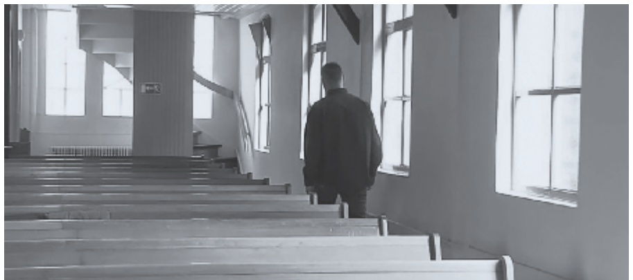
▶ Kerkverlaters konden elkaar ontmoeten op een lotgenotendag.

Zeker in de huidige tijd vraagt de omvangrijke kerkverlating onze aandacht. Het is een droevige zaak. Maar daarbij moeten we wel bedenken dat zowel verloren zonen als oudste zonen de waarachtige bekering tot God nodig hebben. ♦