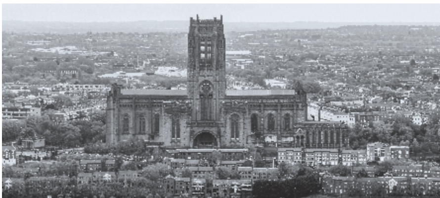
▶ Liverpool Cathedral.

Als besluit van dit hoofdstuk zegt Ryle dat geen mens mag zeggen dat, als de Heere deze gezegende verandering niet schenkt, hij er toch ook niets aan kan doen. 'Als een bidde-loos mens in de dag des oordeels zal zeggen: Ik kon niet tot Christus komen, dan zal het antwoord zijn: Gij hebt het niet geprobeerd'. ♦