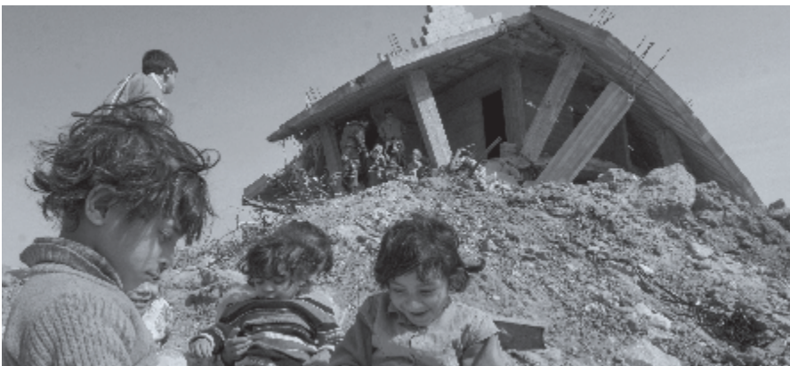
▶ Veel Israëli's leven zonder hoop. De arme mensen, die in Gaza zuchten onder een satanisch regime, hebben ook geen hoop.

Veel Israëli's leven zonder hoop. De arme mensen, die in Gaza zuchten onder een satanisch regime, hebben ook geen hoop. Dat is het droevige van deze oorlog. Laten we smeken dat de Heere opstaat, de HEERE der heirscharen, 'Die de oorlogen doet ophouden tot aan het einde der aarde, den boog verbreekt en de spies aan twee slaat, de wagens met vuur verbrandt' (Ps. 46:10). En u in Nederland? U mag in vrede leven. Mag u die blijdschap kennen waarover Ezra en Nehemia spreken? Jonge mensen, nemen jullie het Woord van God ter harte? Bidt om de vrede van Jeruzalem. ♦