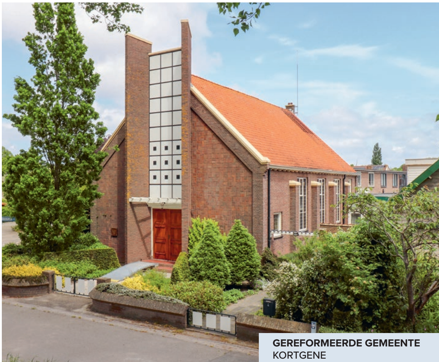
GEREFORMEERDE GEMEENTE KORTGENE