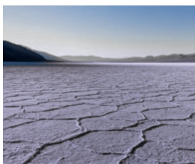
08 Het gezicht van Ezechiël