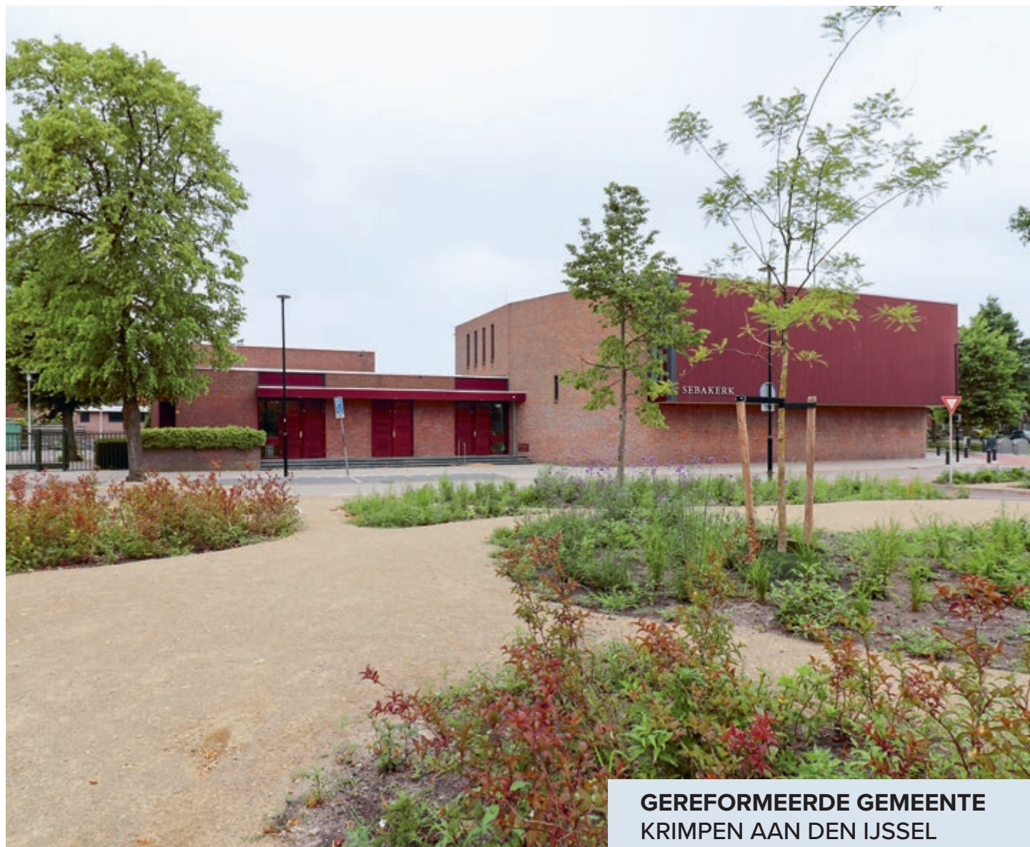
GEREFORMEERDE GEMEENTE KRIMPEN AAN DEN IJSSEL