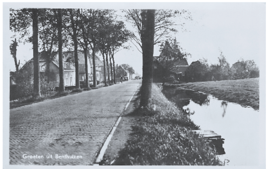
Groeten uit Benthuizen

Dat wordt op aarde nooit ten volle geleerd en daarom blijft het gebed: 'O Goede Meester leer mij toch, Gij weet, ik ben zoo zondig, Gij weet het, ach! Uw kind is nog zoo dwaalziek en onmondig'. Maar er is één troost, in de laatste strofe verwoord: 'Bij U is wijsheid, licht en kracht, Gij redt mijn ziel