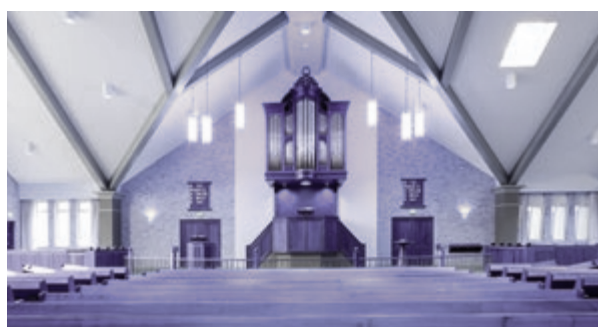
12 Een wijnstok in De Valk-Wekerom