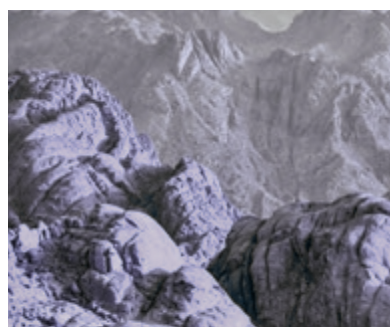
04 Ik ben de HEERE uw God