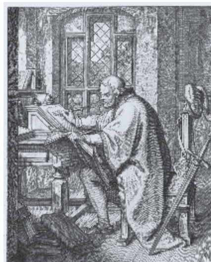
► Luther vertaalt de Bijbel.

Luthers 31 oktober is voor ons van grote betekenis. God wilde de lamp van Zijn Woord weer helder laten schijnen na de donkere middeleeu-