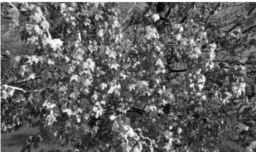
▶ De sneeuw op de felgekleurde bladeren van een esdoorn.

Er staat echter in deze tekst nog wat achter: 'Zij wordt op de weg der gerechtigheid gevonden'. We moeten dus altijd even doorlezen, geen halve teksten citeren, wat helaas weleens gebeurt. De grijsheid op zich is namelijk niet die kroon. Niet onze wijsheid, levenservaring en wat dies meer zij is die kroon. Het is slechts dán een kroon en een sieraad als het verbonden is aan een wandel op het pad der gerechtigheid. Charles Bridges beschrijft het kernachtig zo: 'Plechtig verbindt de Heere de eer (van die kroon, HH) met Zijn eigen vreze'. Dát deed Jakob wachten op Jeshua's zaligheid. Dat deed Zacharias en Elisabet beiden rechtvaardig zijn voor God en rechtvaardig wandelen in al de geboden en rechten des Heeren. En dat deed de oude Anna niet wijken uit de tempel, waar ze God met vasten en bidden diende nacht en dag. Kent u die wandel? Ditmaal was het een 'Van overzee' voor ouderen. In de hoop dat jongeren het ook lezen, want we hebben allemaal hetzelfde nodig. ♦