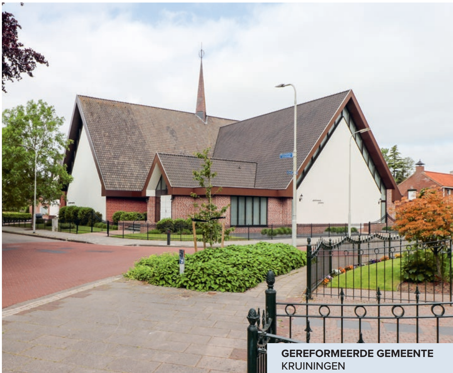
GEREFORMEERDE GEMEENTE KRUINGEN