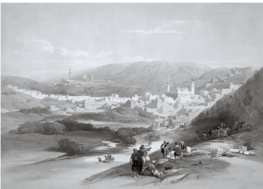
► Zacharias en Elisabet hebben door genade geleerd in een nieuw Godzalig leven te wandelen.

Zacharias en Elisabet bewonen een huis met een binnenkamer. En in kinderlijke ootmoed hebben ze die binnenkamer opgezocht, de deur gesloten en geroepen tot de Vader, Die in het verborgene ziet. Ze hadden