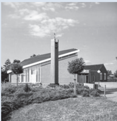
Exterieur van de Aakerk te Wierden-Aadorp.