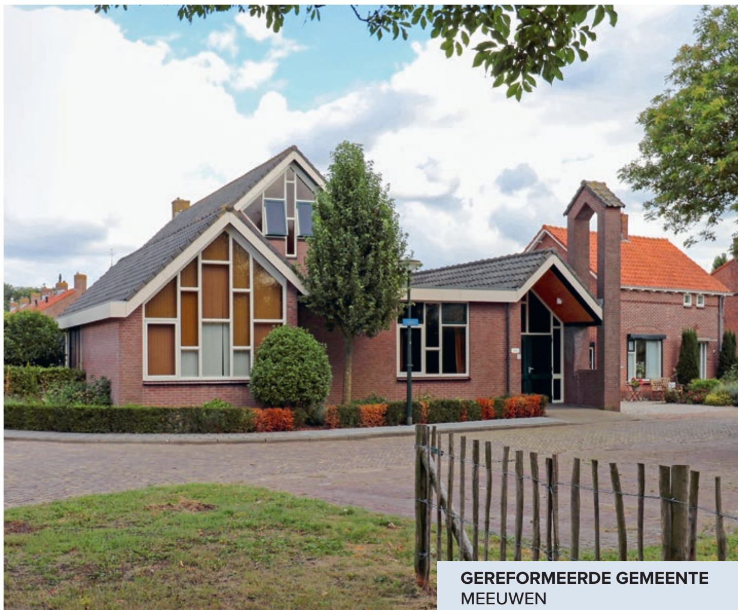
GEREFORMEERDE GEMEENTE MEEUWEN