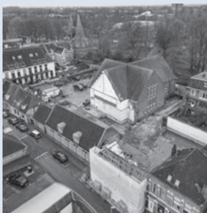
Verbouwing Poortkerk te Kampen