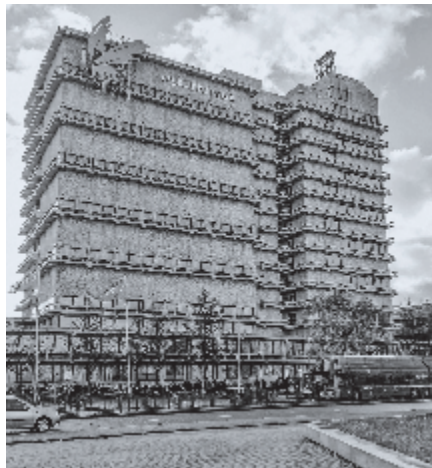
► VU Amsterdam

Vriendelijk zijn en liefde betonen aan de naaste, wie hij of zij ook is, is de plicht van iedere christen. Als daardoor mensen, ook extremisten, gewonnen worden voor het Koninkrijk van God, is dat een wonder van Gods genade. De Heere kan het bewijzen van die liefde zo gebruiken dat de islamitische extremist gaat twijfelen aan zijn geloof in de Koran. Liefde is immers in staat om het hardste hart te