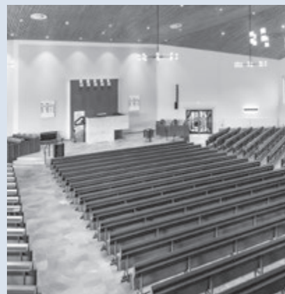
Interieur van de kerk te Ridderkerk