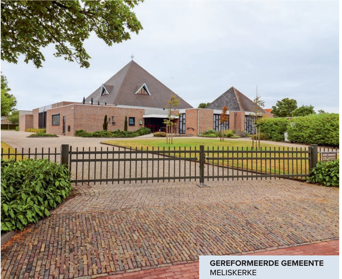
GEREFORMEERDE GEMEENTE MELISKERKE