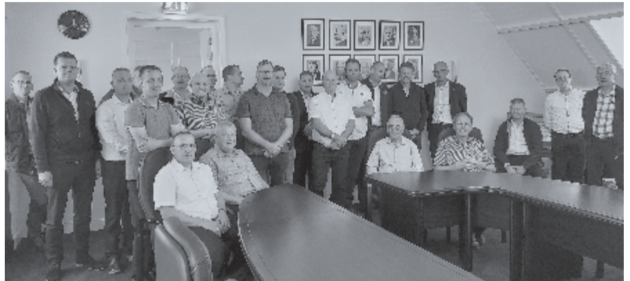
► De mannenvereniging uit Urk op bezoek bij de Theologische School.

Wie zal de eerste zijn die een mailtje stuurt of een telefoontje doet? Info: m.bogerd@mail.com, tel. 06-51202481