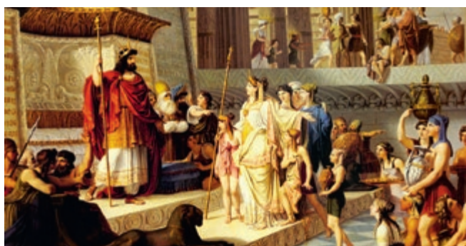
▶ 'En zij kwam te Jeruzalem met een zeer zwaar heir'.