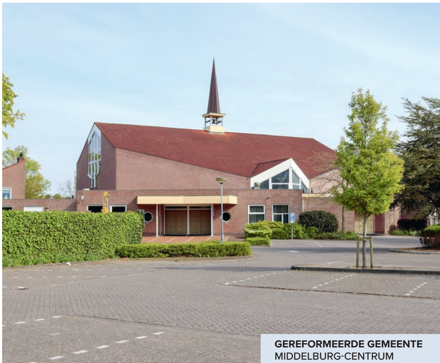
GEREFORMEERDE GEMEENTE MIDDELBURG-CENTRUM