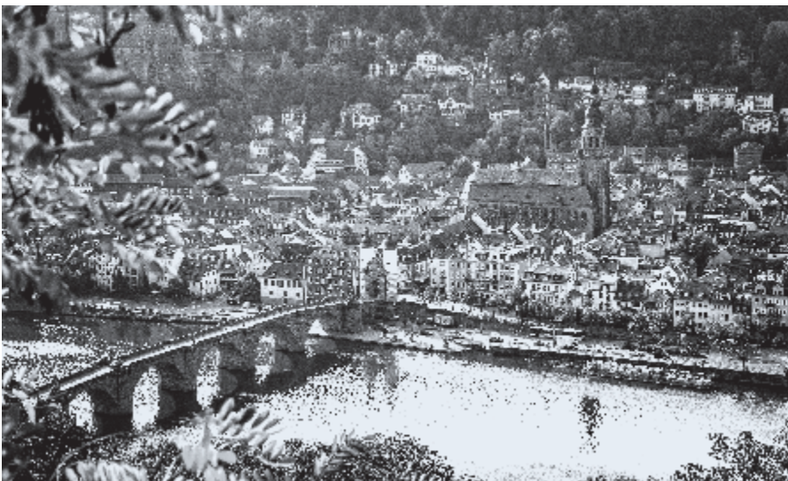
► In Duitsland, het land waar Luther en Kohlbrugge hebben gepreekt, en waar de Heidelbergse Catechismus is ontstaan, is de geestelijke armoede onmetelijk groot. Foto: de stad Heidelberg.