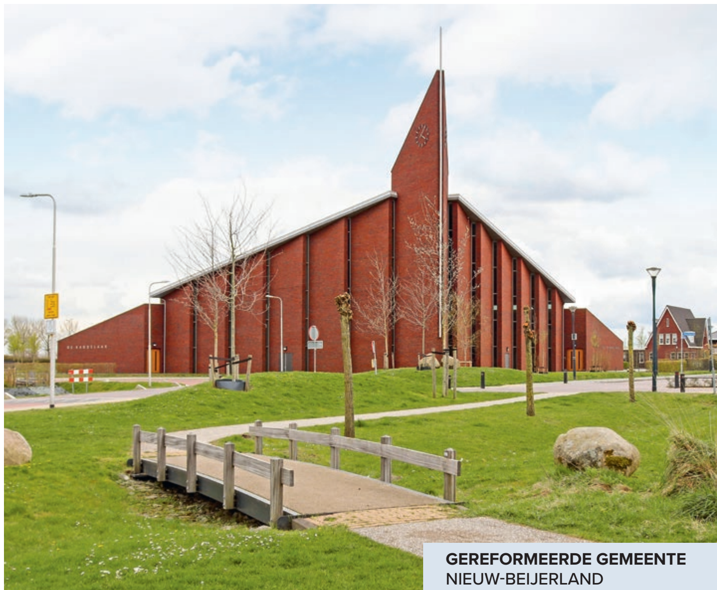
GEREFORMEERDE GEMEENTE NIEUW-BEIJERLAND